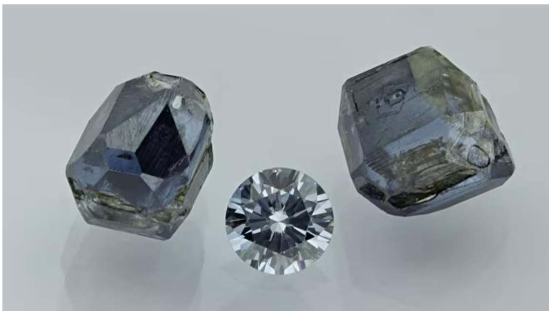
Obrázek 8: Diamanty vyrobené z křemáčního popela ([křemáční diamanty], c2024)