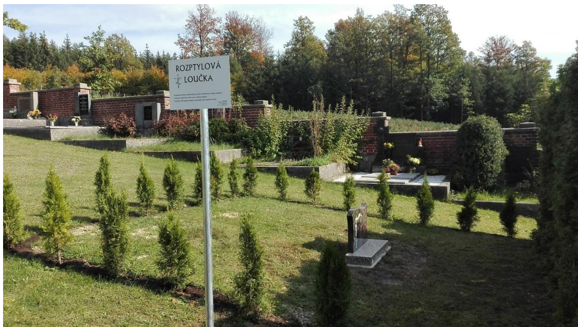
Obrázek 4: Rozptylová loučka (Rozptylová loučka, c2024)