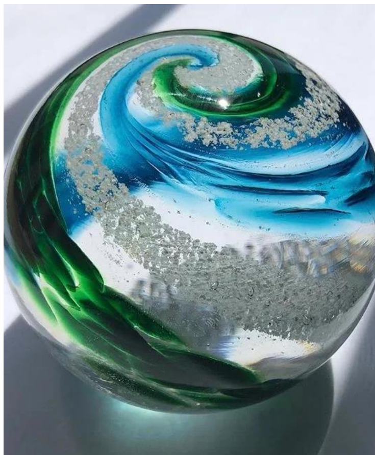
Obrázek 9: Těžítka s křemáčním popelem (Ashes in glass 1.5" orb / Cremation glass orb paperweight, c2020)