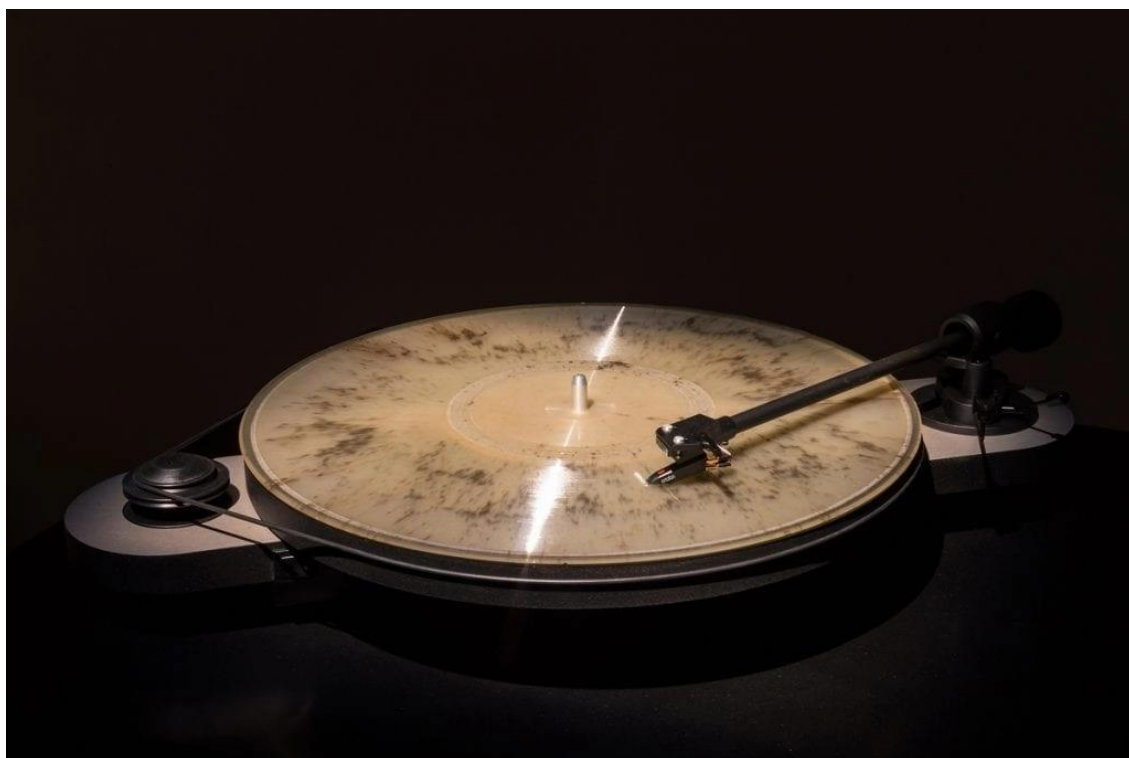
Obrázek 6: Vinylová deska s křemačním popelem (Ashes put into a Vinyl Record, c2024)