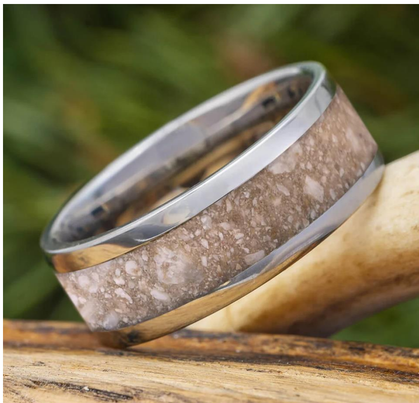
Obrázek 7: Pamětní prsten s křemačním popelem (SIMPLE, TITANIUM MEMORIAL RING WITH ASHES, c2024)