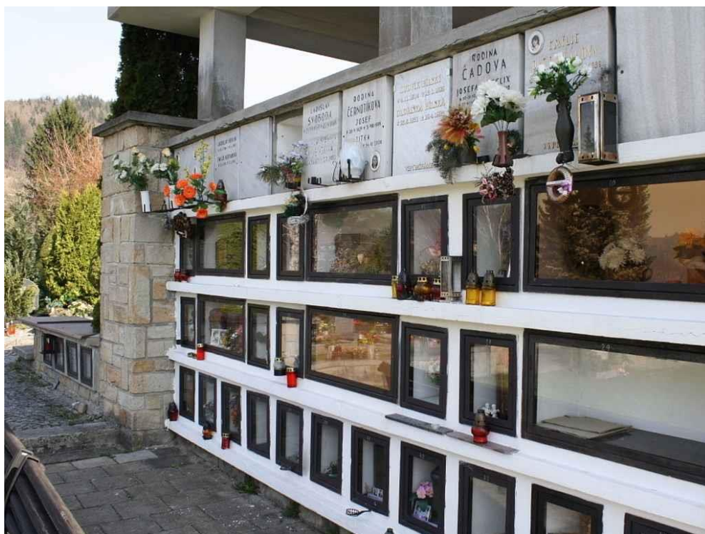
Obrázek 2: Kolumbárium (Fojtík, 2019)