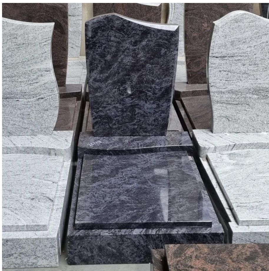
Obrázek 3: Urnový hrob (Gumanová, c2023)