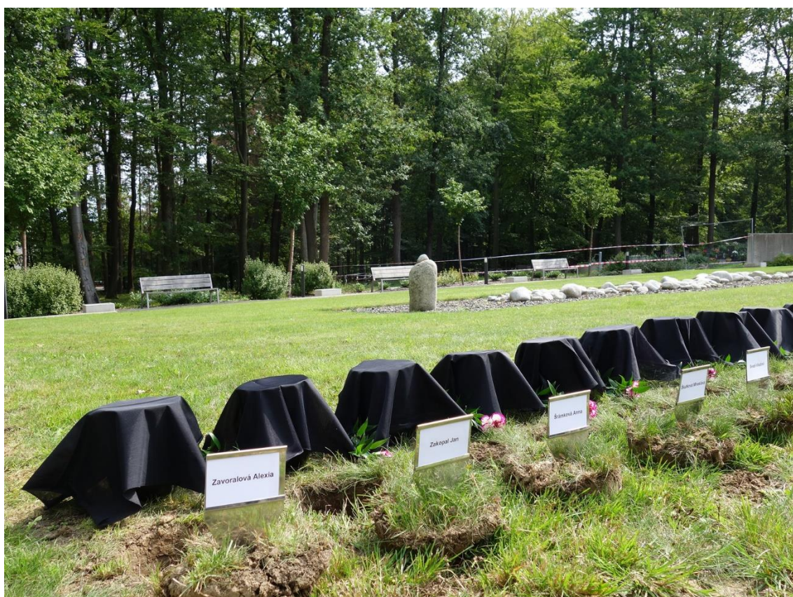
Obrázek 5: Vsypová loučka (Večerková, 2019)