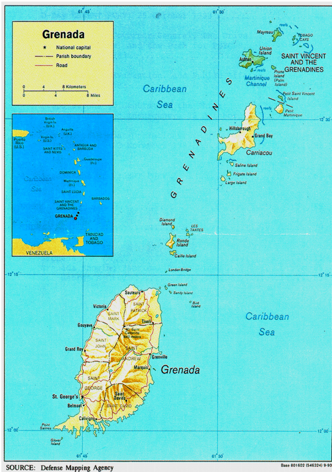
Příloha č. 1: Geografická mapa Grenady.