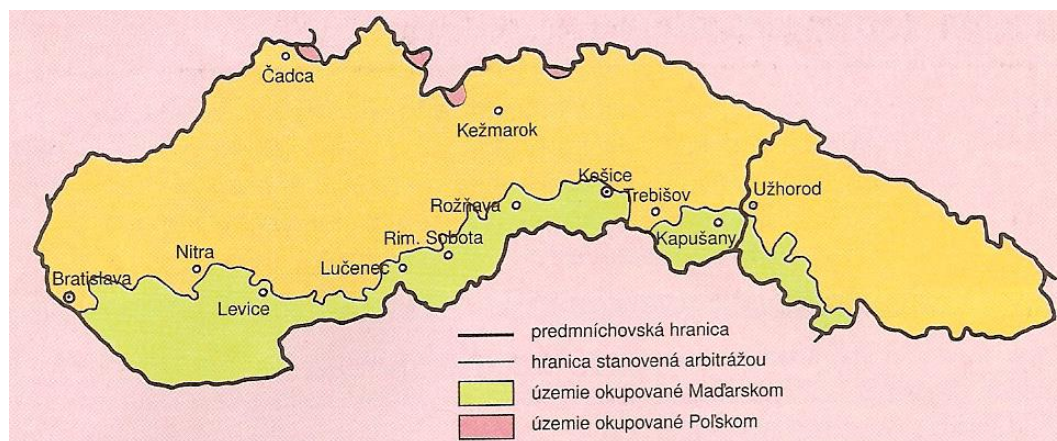
Obrázek č. 1 - Znázornění území odstoupeného Maďarsku

na skutečnost, že zatímco na základě zmíněné Trianonské mírové smlouvy bylo na území Slovenska nuceno žít stěží 6 % maďarského obyvatelstva, po vídeňské arbitráži však zcela neúměrně mělo naproti tomu na území Maďarska bydlet až 20 % příslušníků slovenské menšiny. 86