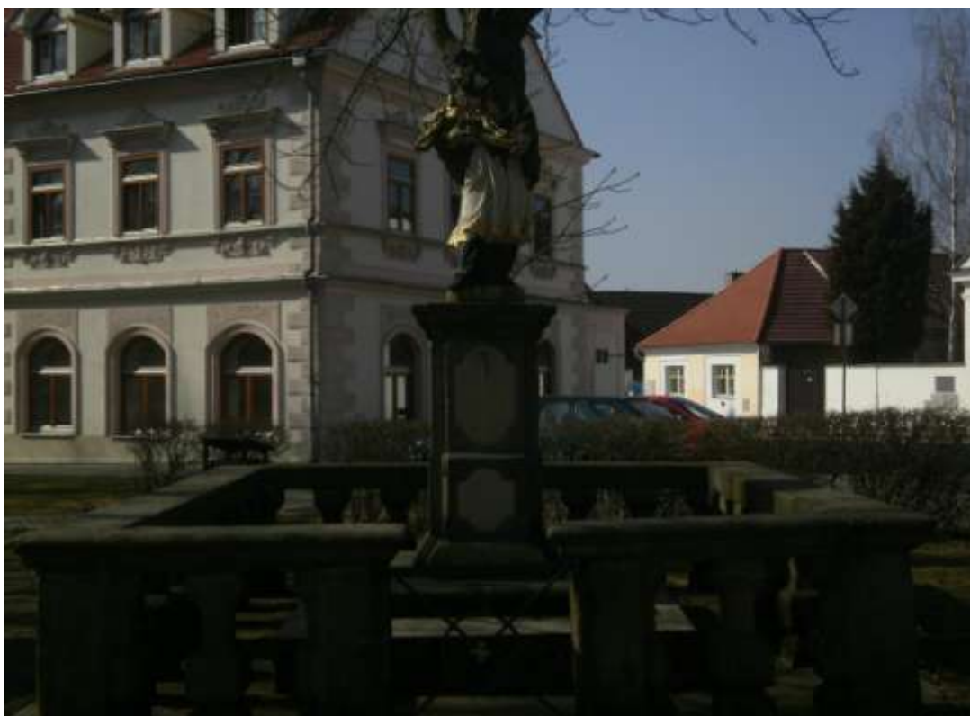
Příloha č. 23: Novodobá kopie Svatohorské Panny Marie