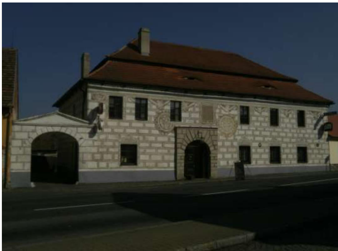
Příloha č. 15: Sgrafita šternberského domu.