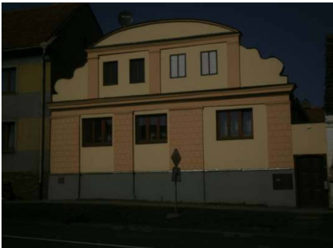
Příloha č. 17: Lidová architektura (čp. 103).