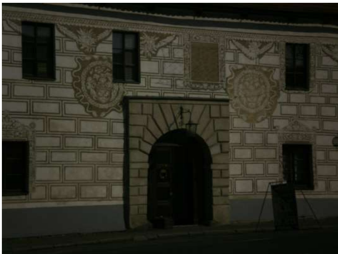
Příloha č. 16: Lidová architektura (čp. 107).