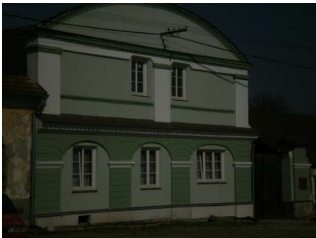
Příloha č. 18: Kabelíkův mlýn.