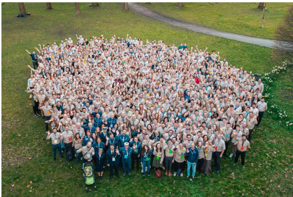
Obrázek 1: Účastníci Valného sněmu 2024 – autor Štěpán Filip (skautská přezdívka: Světluška)

Dle zdrojů na hlavní stránce Junáka – českého skauta je pro rok 2024 v České republice registrováno 76 711 skautů a skautek a jsme největší výchovnou organizací pro děti a mládež v Česku. (a. Junák-český skaut, z.s., 2024)