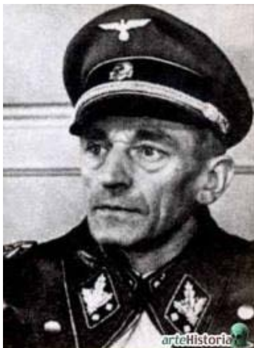
Obrázek 6: Karl Hermann Frank