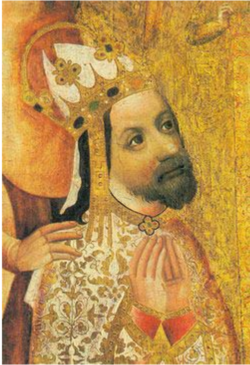
Obrázek 4: Karel IV.