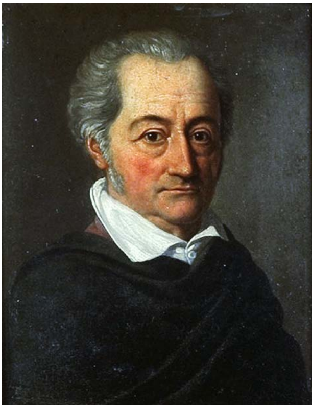
Obrázek 5: Johann Wolfgang Goethe