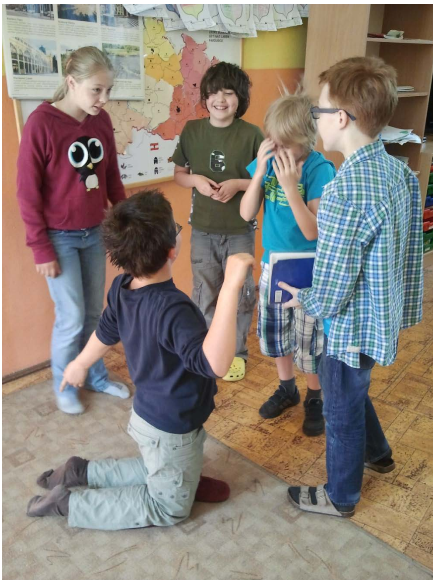
Obrázek 8: Žáci při dramatizaci pověsti o Štrakalovi