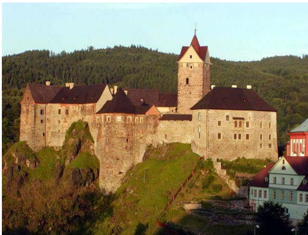
Obrázek 2: Hrad Loket