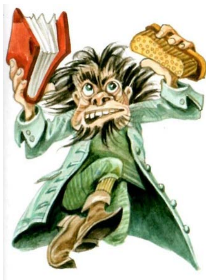
Obrázek 7: Štrakakal