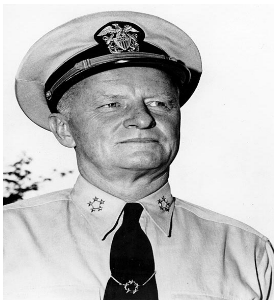
Příloha č. 1, Admirál Spojených států amerických Chester Nimitz [cit. 2013-4-10]