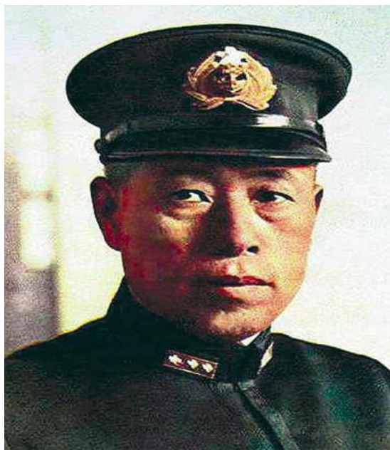
Příloha č. 2, Admirál Japonského císařství Isoroku Yamamoto (zdroj: < http://simonak.eu/index.php?stranka=pages/h_k/11_13.htm >) [cit. 2013-4-10]