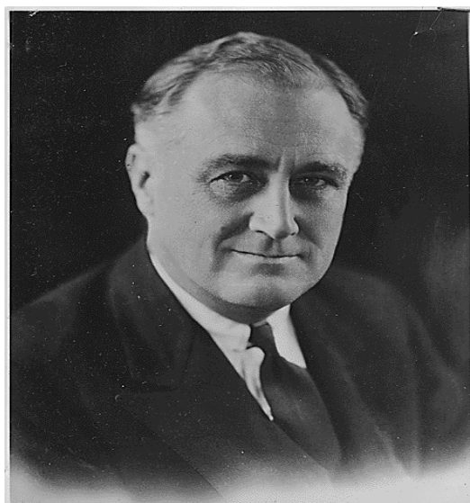
Příloha č. 3, Prezident Spojených států amerických Franklin D. Roosevelt

(zdroj: < http://history1900s.about.com/od/photographs/tp/Pictures-Of-Roosevelt.htm >) [cit. 2013-4-10]