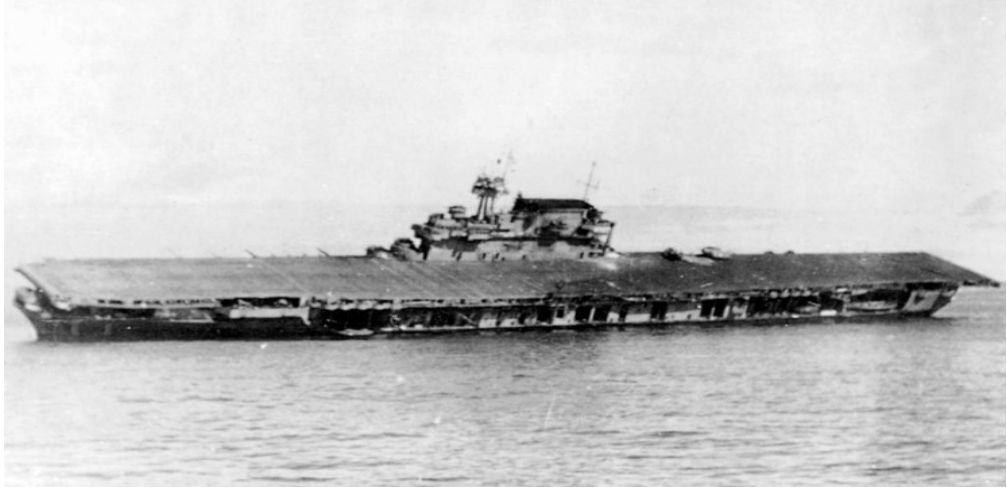
Příloha č. 7, Potápějící se americká letadlová loď USS Yorktown [cit. 2013-4-10]