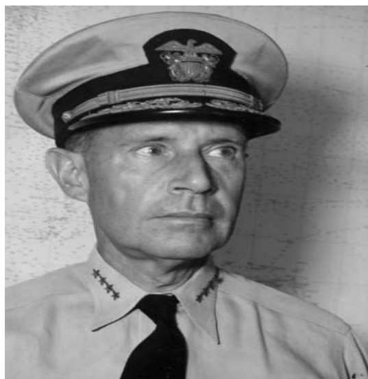
Příloha č. 4, Admirál Spojených států amerických Raymond A. Spruance

(zdroj: < http://history1900s.about.com/od/photographs/tp/Pictures-Of-Roosevelt.htm >) [cit. 2013-4-10]