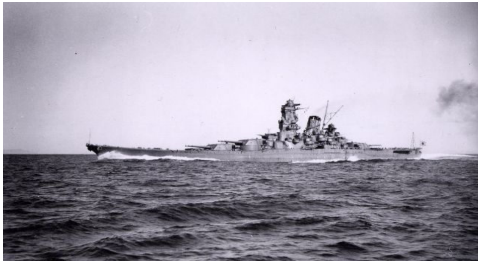
Příloha č. 8, Obří japonská bitevní loď Jamato [cit. 2013-4-10]