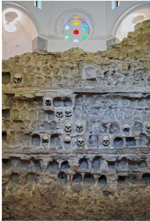
Kele Kula – věž lebek

http://tejiendoelmundo.wordpress.com/2010/03/06/cele-kula-la-torre-de-las-calaveras/ [cit. dne 16. 4. 2013]