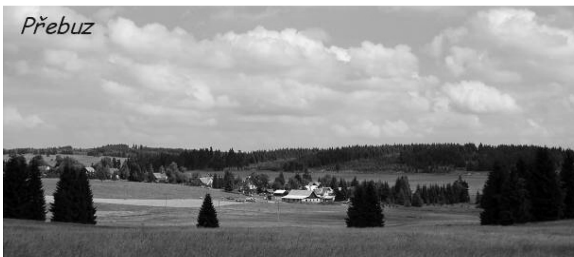
Obrázek č. 4 Přebuz v současné době, osobní archiv Mgr. Pavla Andrše.