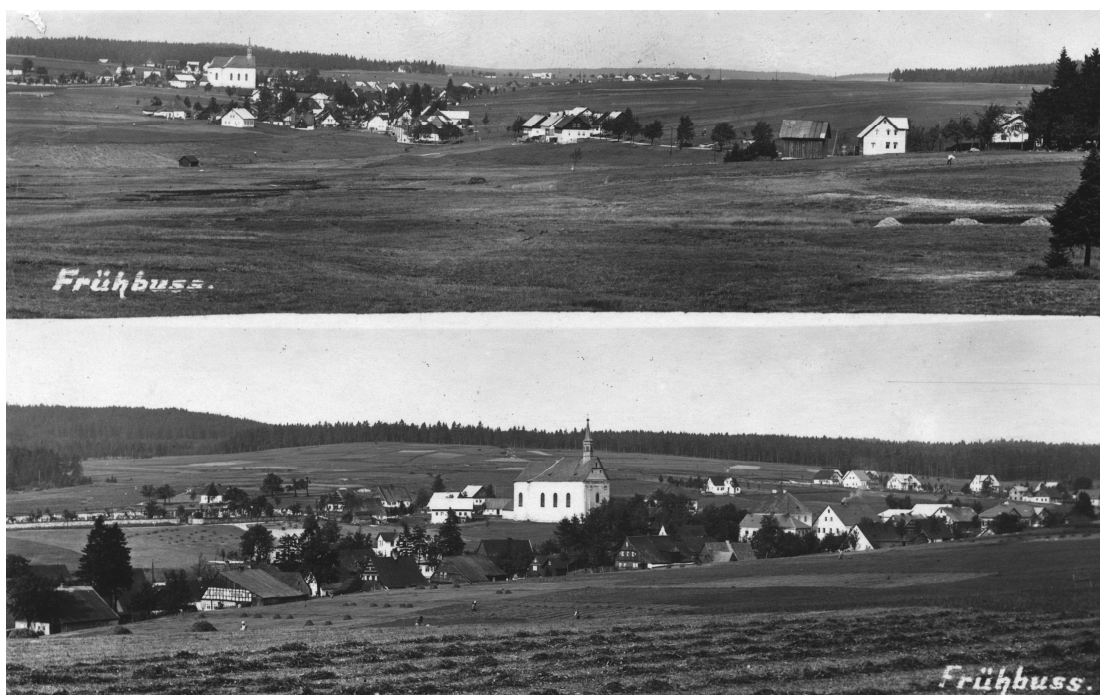
Obrázek č. 3 Obec Přebuz ve 30. letech 20. století, soukromý archiv Mgr. Pavla Andrše.