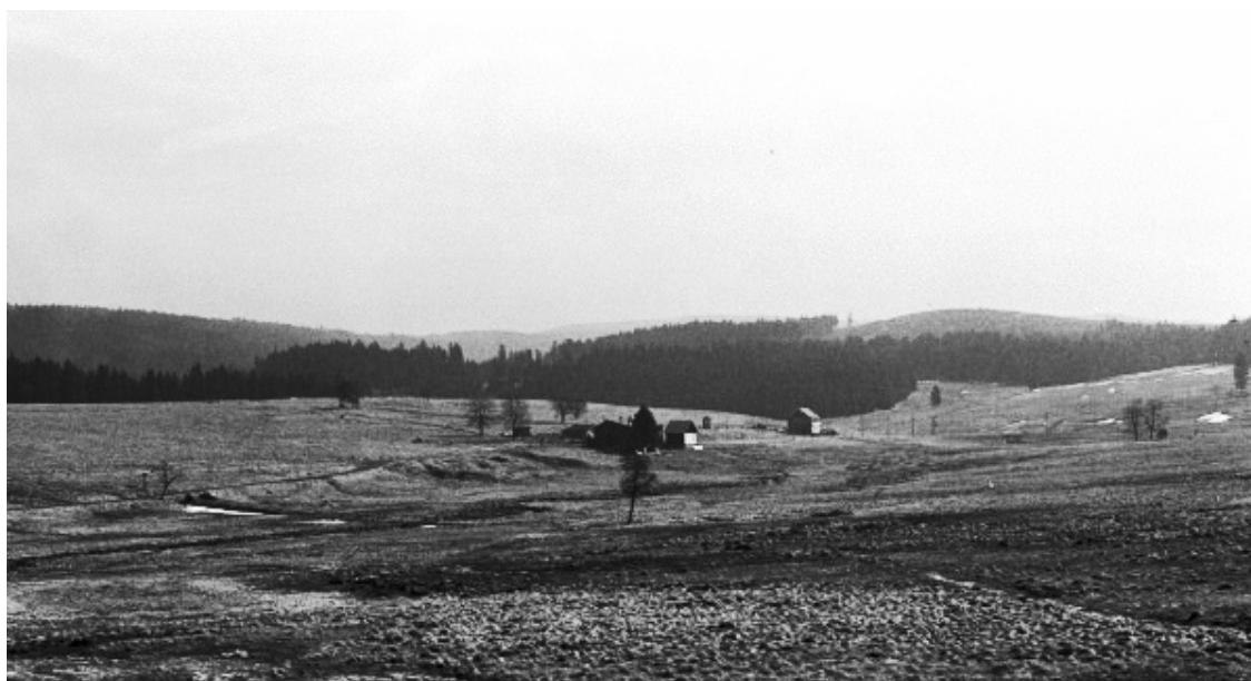
Obrázek č. 2 Bývalá obec Jelení v současné době, též. Mgr. Andrš.