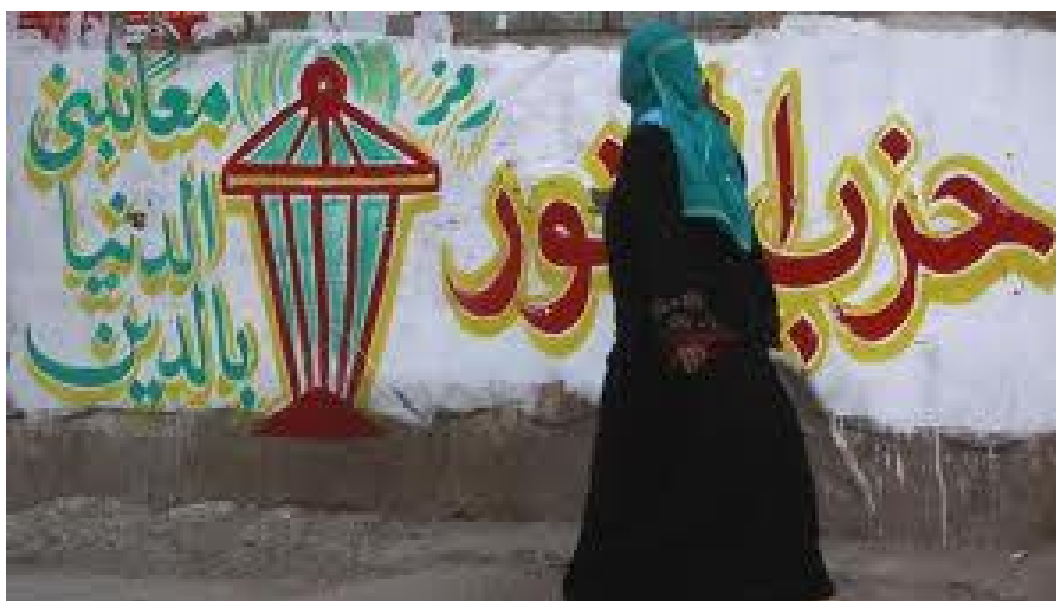
Příloha č. 5. Umění ulice. Žena míjí znak a slogan strany an-Núr: Společně, ruku v ruce, budujeme zemi skrze náboženství.