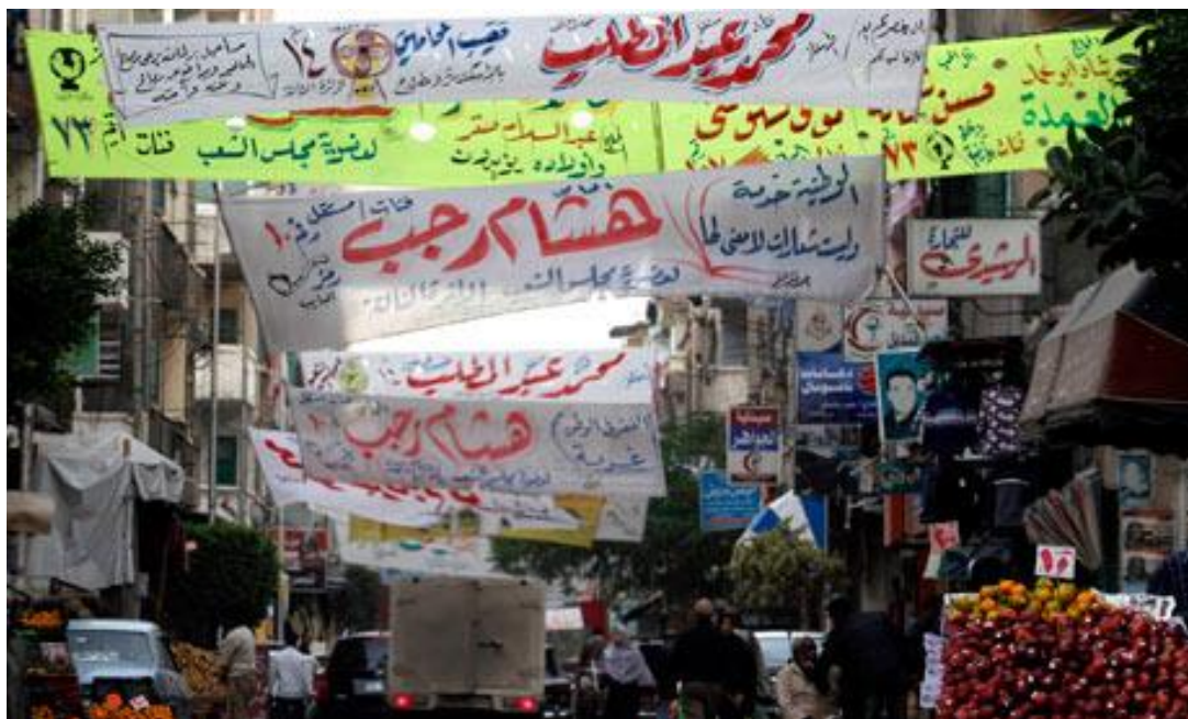
Příloha č. 4. Transparenty.

(převzato http://www.guardian.co.uk/world/middle-east-live/2011/nov/27/egypt-middleeast cit. dne 10.2.2013)