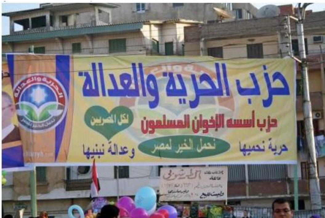
Příloha č. 6. Přinášíme Egyptu dobro. Pozdější heslo Muslimských bratří.