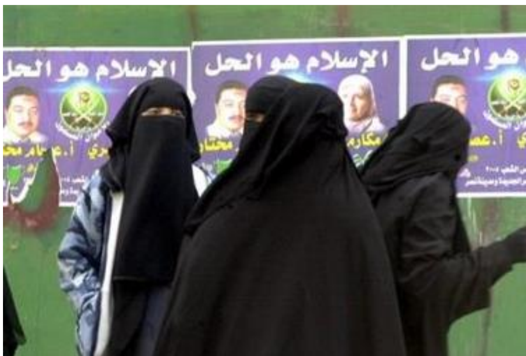
Příloha č. 7. Islám je řešení. Ženy v niqábech a v pozadí volební plakáty s kandidáty Muslimského bratrstva a heslem „Islám je řešení“.