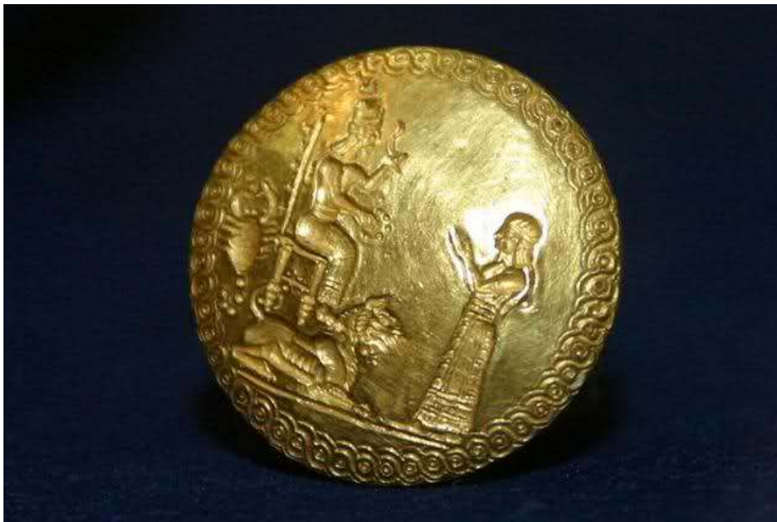
Příloha č. 8: Pečetítko královny s motivem štíra.

( http://s6.zetaboards.com/Free_Thinkers/topic/8800589/1/ )