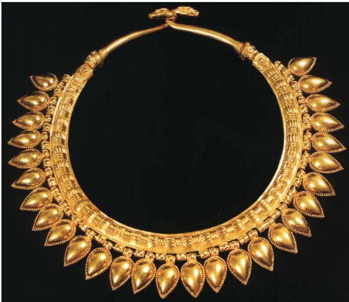
Příloha č. 3: Zlatý náhrdelník ze zlatého pokladu nalezeného v Nimrudu v hrobce č. II.