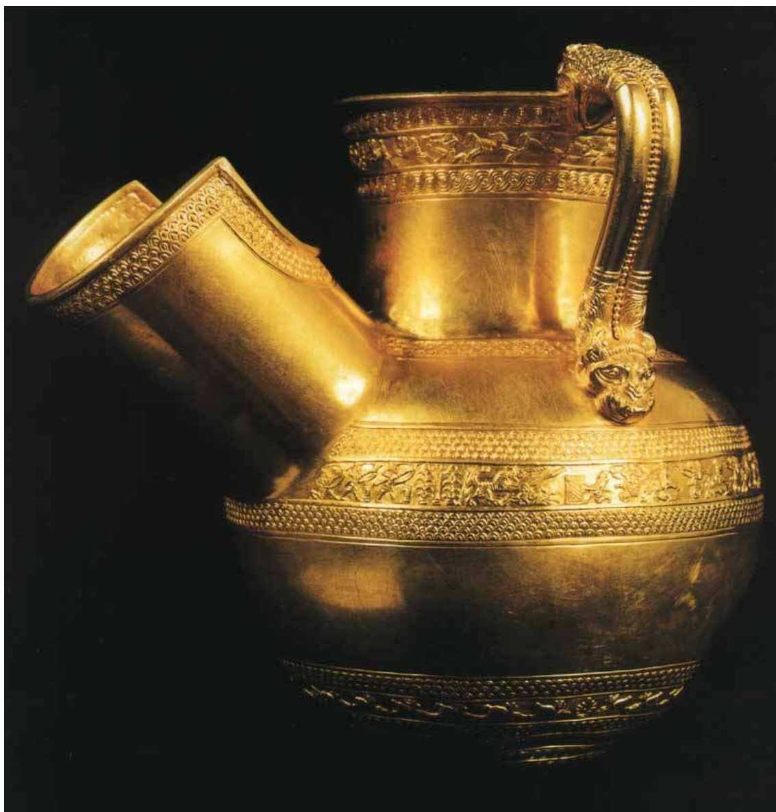
Příloha č. 6: Zlatý džbán.