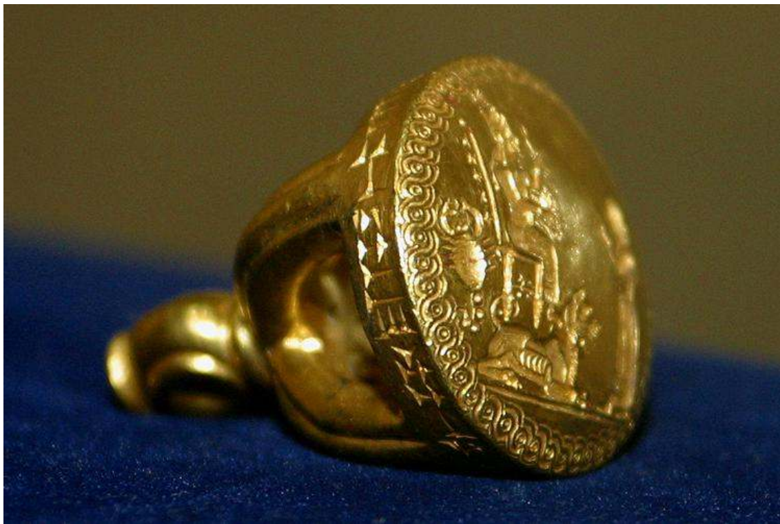
Příloha č. 9: Pečetítko královny s motivem štíra.

( http://www.helsinki.fi/science/saa/sas21cov.html )