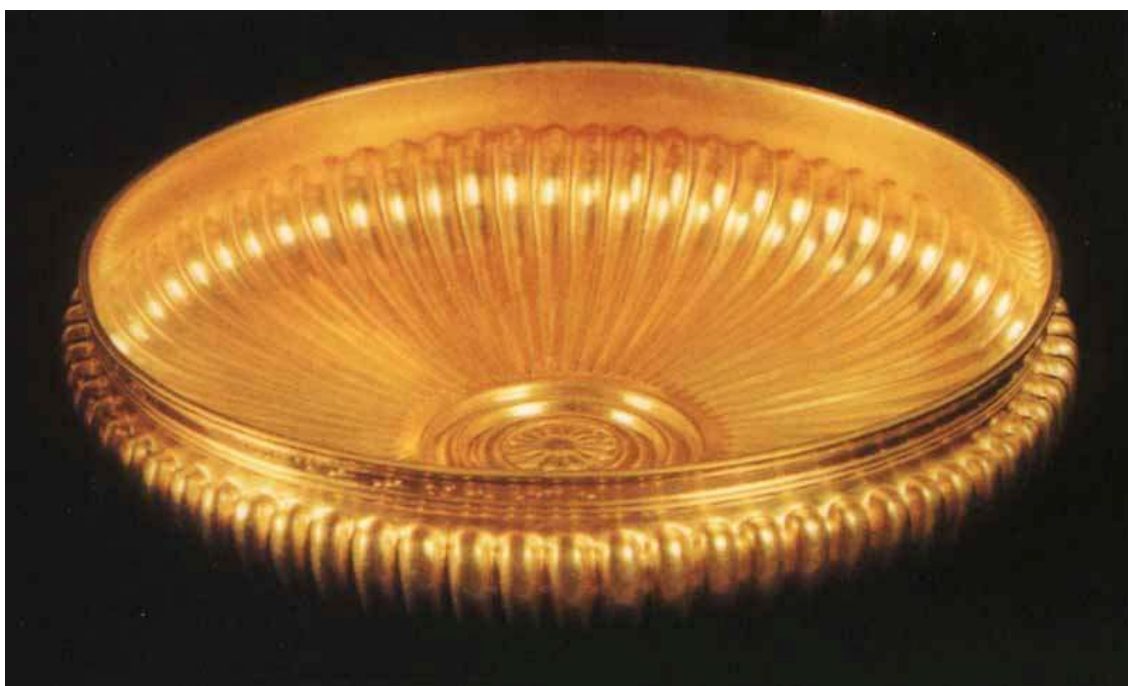
Příloha č. 5: Zlaté mísy.