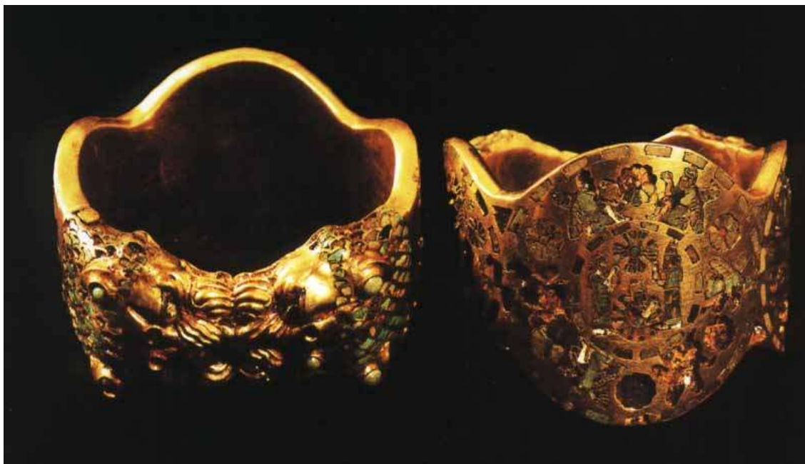
Příloha č. 4: Zlatý prsten s motivy postav precizně vykládanými drahými kameny.