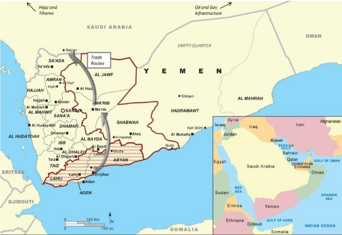
(Kagan, W., Frederick, 2011).