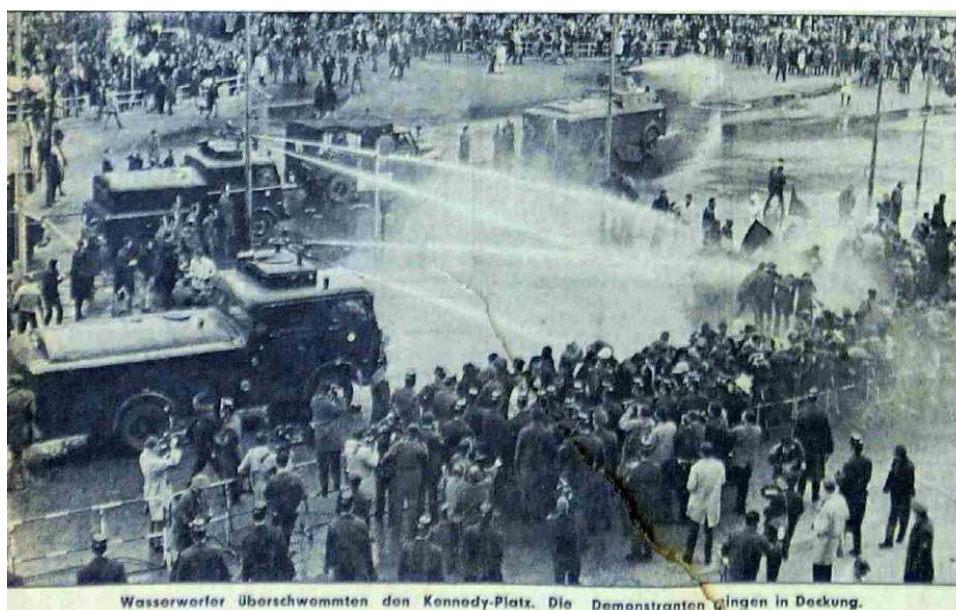
Obrazová příloha č. 9 – Zásah policistů s vodními děly dne 13. dubna 1968 na náměstí Johna F. Kennedyho před radnicí v Schönebergu. 297