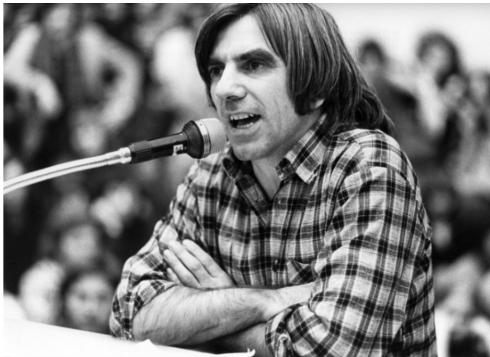
Obrazová příloha č. 1 – Ikona studentských protestů – Rudi Dutschke (1940–1979). 291