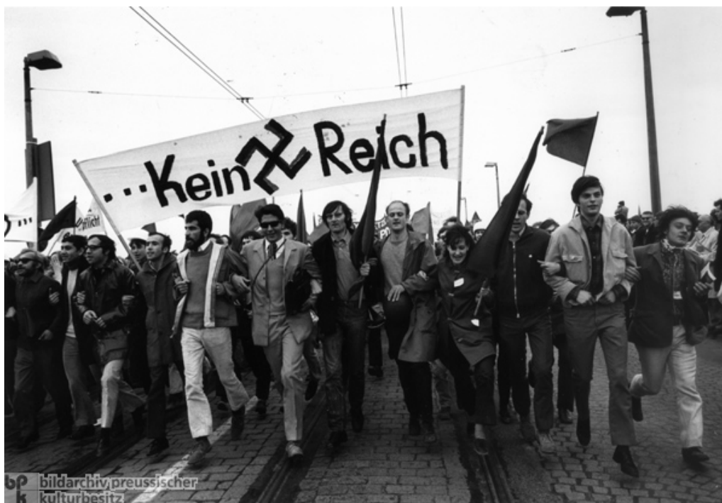
Obrazová příloha č. 10 – Demonstrace v Bonnu z 11. května 1968. 298