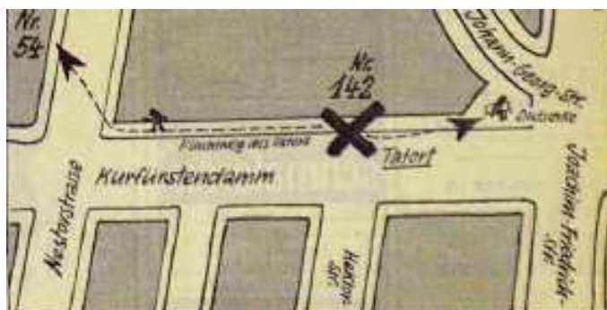
Obrazová příloha č. 5 a č. 6 – Místo činu včetně Dutschkeho bot. 295