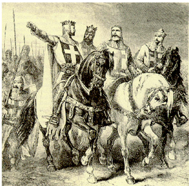
Gustave Doré: Vůdcové první křížové výpravy