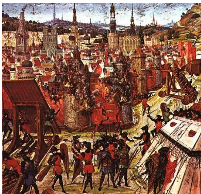
Křižáci dobývají Jeruzalém na středověkém iluminovaném rukopisu