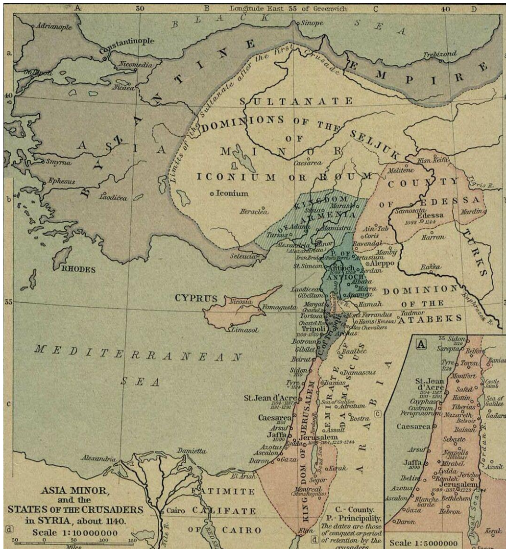
Blízký východ klem roku 1140