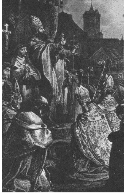
Gustave Doré: Papež Urban II. vyzývá v Clermontu k osvobození Svaté země