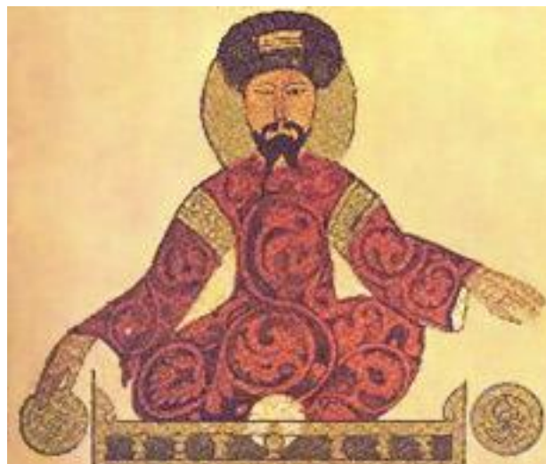
Podobizna sultána Saladina