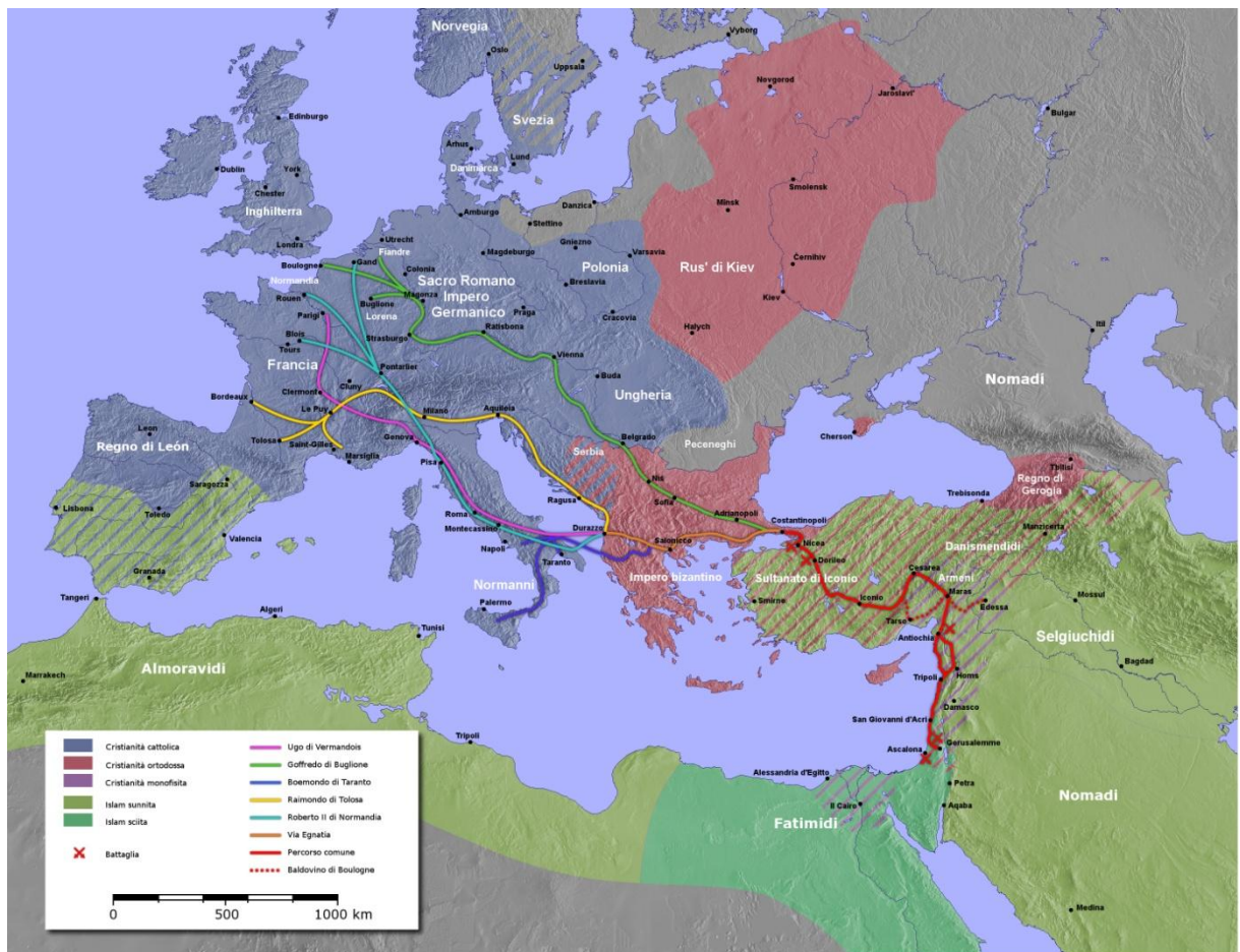
Mapa postupu první křižové výpravy