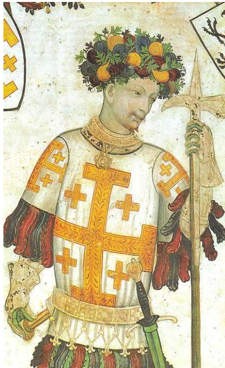
Chránce Božího hrobu Godefroy z Bouillonu