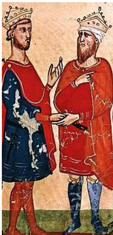
Vyobrazení setkání císaře Fridricha II. se sultánem al-Kámilem