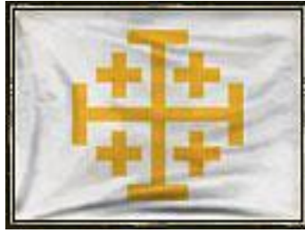
Znak Jeruzalémského království