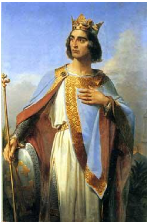
Moderní podobizna krále Balduina I.