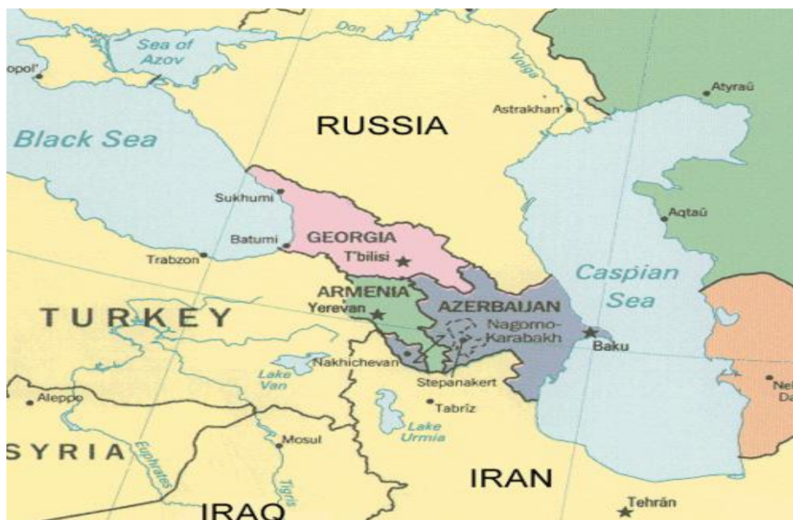
Mapa oblasti Kavkazu