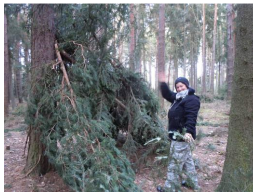
Obrázek 9: Kmen „Ugu“ buduje svůj příbytek