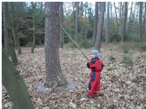
Obrázek 11: Jakub hladí strom

V reflexi se účastníci mimo jiné vyjadřovali k tématu rituálů, každý z nich řekl, co pro něj znamená pojem „rituál.“