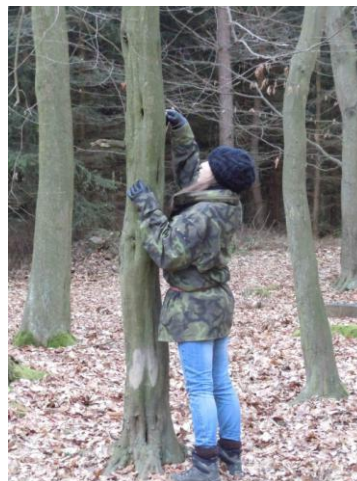
Obrázek 12: Předávání dopisu