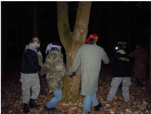
Obrázek 6: Účastníci v „hadu“

Po reflexi jsme zůstali v kruhu a sdělila jsem účastníkům zadání další části aktivity, kterou byla procházka v lese potichu a poslepu v „hadovi,“ kde se nevidomí účastníci budou držet za ruce a půjdou za vůdcem, který uvidí. Účastníci v hadu se chytli za ruce, prvnímu v řadě jsem sundala šátek. „Had“ se dal nejdříve do pohybu. Během procházky se lidé v čele vystřídali, ukazovala jsem jim přibližnou cestu kudy mají jít, ale někteří rádi obkroužili strom dvakrát nebo vybírali více neschůdné úseky. Po zhruba třiceti minutách procházky jsem účastníkům sundala šátky a ve svitu baterky jsem jim ukázala výtisk díla „Vymezení“ od Jiřího Valocha. Poté jsme se věnovali reflexi.