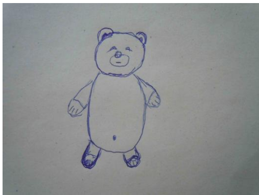
Obrázek 8: Milošova kresba medvěda

Po dobudování příbytků jsem vyhlásila změnu jazyka, abychom při reflexi mohli komunikovat v češtině. Po reflexi jsem pro srovnání účastníkům ukázala výtisk díla francouzských land artových umělců Bruniho a Babarita, kteří také tvoří v lese příbytky z přírodních materiálů, a sdělila jsem všem motivaci na další aktivitu.