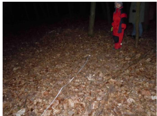
Obrázek 7: Příliš krátká stuha