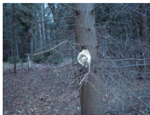
Obrázek 5: Zasazení díla do prostoru