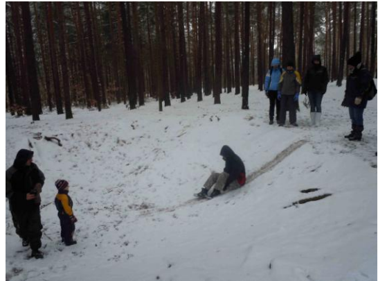
Obrázek 13: Skluzavka