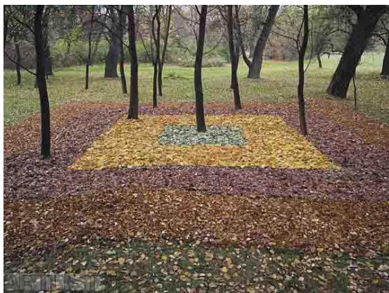
Ivan Kafka- Koberec pro náhodného houbaře