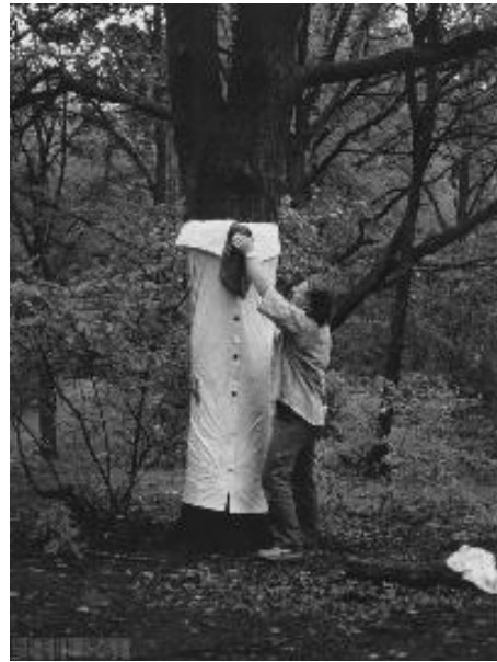
Milan Knížák- Přátelství se stromem