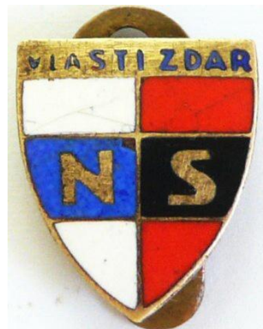
Obr. 7 Odznak Národního souručenství [35]

Tato politická strana byla vyhlášena 6. dubna 1939, a jelikož byly zakázány všechny levicové i pravicové organizace, tak se jedná se o jedinou povolenou politickou stranou, která v protektorátu byla. Její vznik znamenal definitivní konec parlamentní demokracie. Jejími členy mohli být pouze muži (vstoupilo do ní 99 % protektorátních obyvatel). Židům bylo pochopitelně