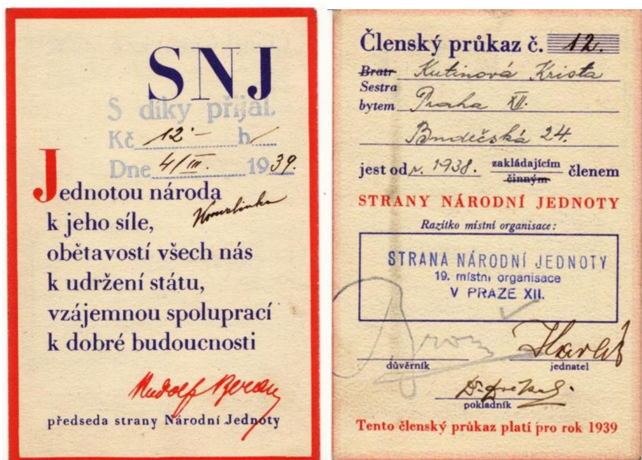
Obr. 3 Členský průkaz Strany národní jednoty pro rok 1939 [32]

V rámci této politické strany existovaly i jiné organizace jako byla Národní jednota žen či Mladá Národní jednota, jejichž obsah programu se příliš nelišil od východisek SNJ. Ti národ pojímali též v rasovém smyslu a vyvozovali nutnost vyloučit židy z politického života.