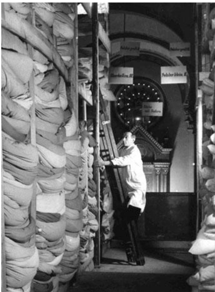
Obr. 9 Sklad arizovaných předmětů v karlínské synagoze[37]

Židovskou otázkou se zabývalo i Národní souručenství. To připravovalo vlastní návrh řešení židovské otázky. Chtělo je vzít pod svou ochranu a zabránit alespoň jejich totálnímu vyhlazení.