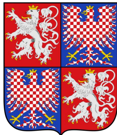
Obr. 5 Velký státní znak Protektorátu [34]

Po zprávách o Tisově iniciativě v Berlíně se E. Hácha rozhodl pro okamžitý odjezd do Berlína za Hitlerem. Nevylučoval, že české země získají alespoň nějakou samostatnost, jako Slovensko. Ovšem o jejich osudu již bylo dávno rozhodnuto. V Berlíně byl Hácha seznámen s Německým úmyslem – o obsazení českých zemí a podepisuje