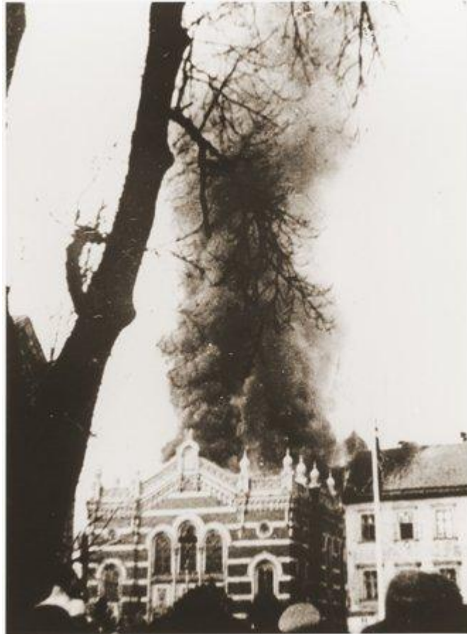
Obr. 4 Hořící synagoga v Opavě 10. 11. 1938 [33]

Jako na jiných územích připojených k Německu se i v Sudetech nacisté snažili o co nejrychlejší vyhnání židovského obyvatelstva. Byli napadáni, vězněni, či přímo vyváženi za hranice. Právě tam, na hraničních čárách se děly hrůzné scény odmítání pomoci. Na jedné straně utíkající židé, na druhé straně četníci s rozkazem ministerstva vnitra, který zakazoval vpouštění židů, kteří neměli na území republiky domovské právo. Nacisté židy z pohraničí s nadšením vyháněli a Češi se snažili za každou cenu zabránit jejich vstupu. Na více místech musely židovské rodiny, včetně dětí a starých lidí, přebývat v polích v zemi nikoho, mezi hlídkami obou zemí. Odmítání židovských uprchlíků a navíc (bývalých) československých občanů dosud nebylo v českém historickém povědomí téměř vůbec reflektováno. Přitom pohraničníci nejednali svévolně, ale na základě rozkazu z Prahy. Navíc se uzavření hranice pro židy nedatovalo od mnichovské dohody, ale přinejmenším už od počátku roku 1938. Jestliže se velká část židů z pohraničí na území druhé republiky přece jen dostala, bylo to především kvůli různým výjimkám, nedůslednosti, nemožnosti zcela uhlídat hranici a také kvůli nátlaku západních mocností. Část těchto uprchlíků se