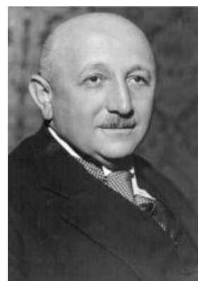
Obr. 2 Rudolf Beran [31]

Tato strana vznikla 22. listopadu roku 1938 a jejím předsedou byl Rudolf Beran. Proces vytváření této strany byl složitější. Jejimi členy se měly stát všechny tehdejší politické strany (kromě sociální demokracie, KSČ a druhé části národních socialistů). Byly to především významné politické strany, jejichž představitelé spojovali různé rekonstrukce politických plánů,