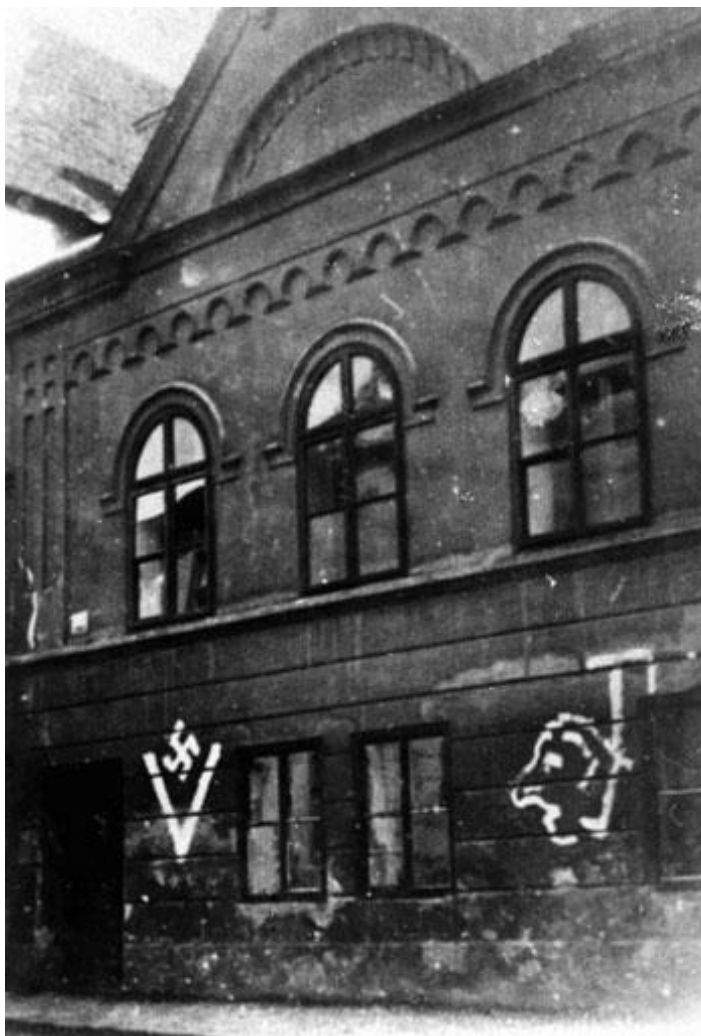
Obr. 8 Synagoga v Třeboní pomalovaná hákovým křížem a karikaturou oběšeného Žida [36]

Již 17. března 1939 přijala Beranová vláda první protižidovská opatření. Byl zakázán výkon lékařské praxe lékařům neárijského původu a 20. března téhož roku vydal Henlein nařízení, které zakazovalo dosazování komisařů anebo správců do židovských podniků. Bylo zakázáno kupovat nebo darovat podniky, které jsou zcela nebo i jen částečně v židovském vlastnictví. Veškerý zabrání židovského majetku bylo ku prospěchu okupační moci. 39 Je jasné, že zavedení všech protižidovských zákonů a následovný arizační proces židovské obyvatelstvo ochudil. Týdeník Židovské obce i přes cenzuru gestapem apeloval na svoje čtenáře, aby emigrovali.