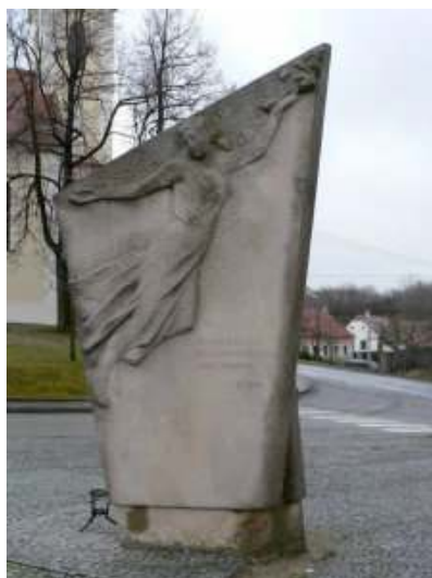
Pomník pro mrtvé funkcionáře v Babicích.

Zdroj: RÁZEK, Adolf: StB + Justice, nástroje třídního boje v akci Babice , Úřad dokumentace a vyšetřování zločinů komunismu, Praha 2002, s. 54