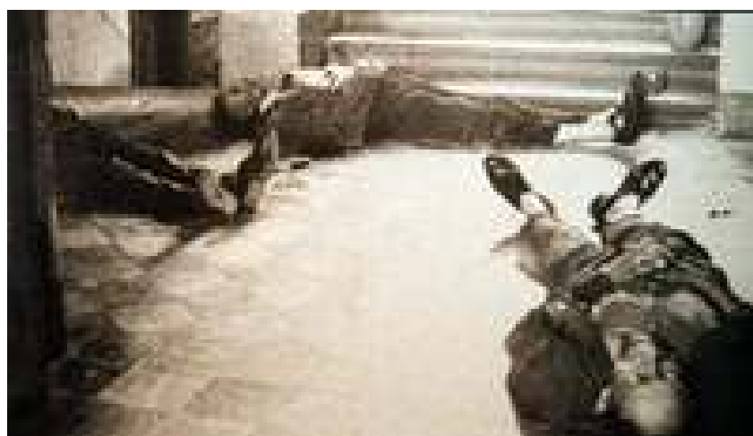
Tři zastřelení funkcionáři v babické škole.