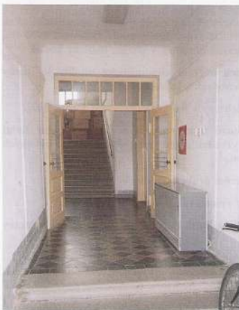
Chodba a přízemí školy, kde došlo ke střelbě.

Zdroj: RÁZEK, Adolf: StB + Justice, nástroje třídního boje v akci Babice , Úřad dokumentace a vyšetřování zločinů komunismu, Praha 2002, s. 54