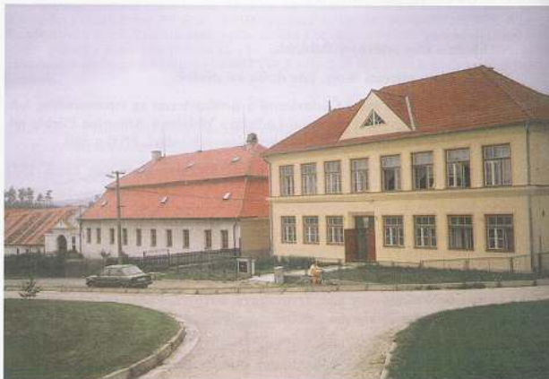
Škola a fara (vlevo) v Babicích.