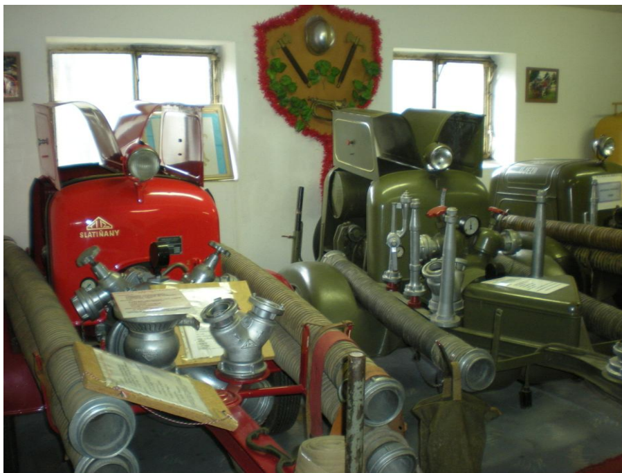
Obrázek č.11 – Expozice Hasičského muzea v Postřekově.

Prvním muzejním objektem je budova bývalé požární zbrojnice, která byla od roku 1985 využívána jako skladiště. V roce 2000 obecní úřad v Postřekově poskytl tento objekt k vybudování muzea, dobrovolníci vzápětí přistoupili k opravě budovy, právě zde byly vystaveny první exponáty, jedná se ve většině případů o motorové stříkačky staršího původu, vůbec nejstarším exponátem je dřevěná stříkačka z roku 1831 89 .