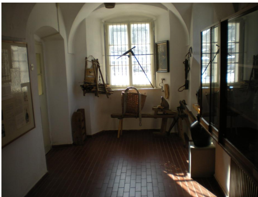
Obrázek č.14 – Expozice Baarova muzea v Klenčí pod Čerchovem.