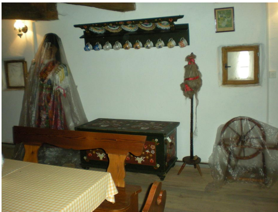
Obrázek č.7 – Expozice Dražnovského špýcharu.