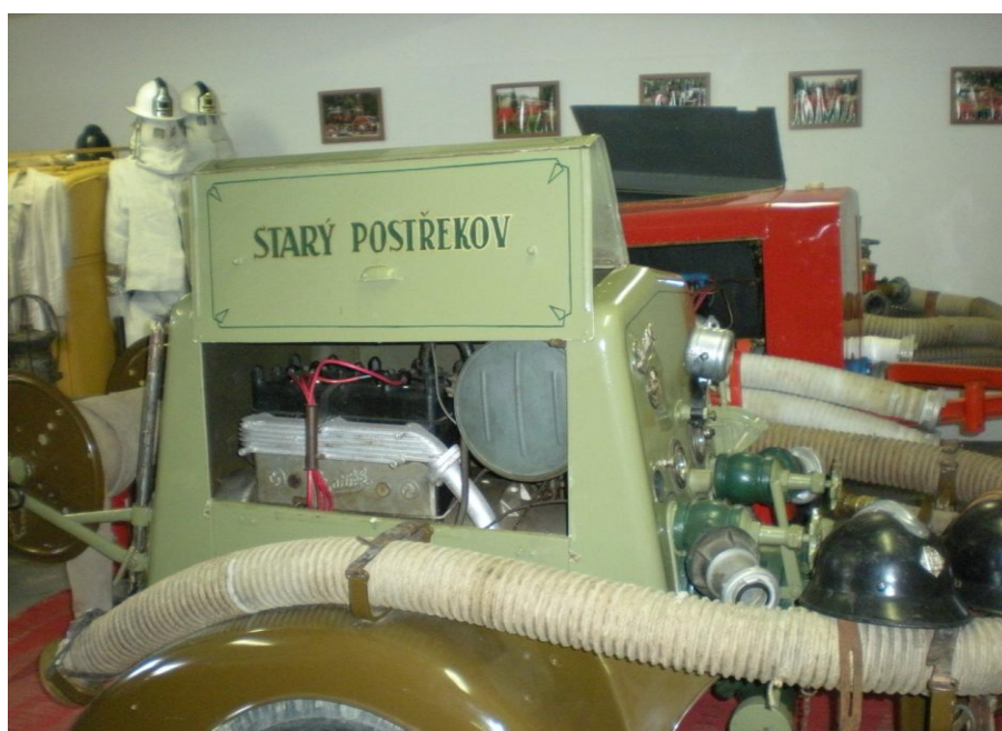
Obrázek č.12 – Expozice Hasičského muzea v Postřekově. 2013.

Muzeum hasičské techniky v Postřekově se řadí mezi muzea užší specializace. Na nevelké ploše se podařilo zřizovatelům shromáždit velké množství exponátů, které jsou v několika případech vzácně dochovanými exempláři hasící techniky, kladen je zde důraz na funkčnost téměř všech přístrojů.