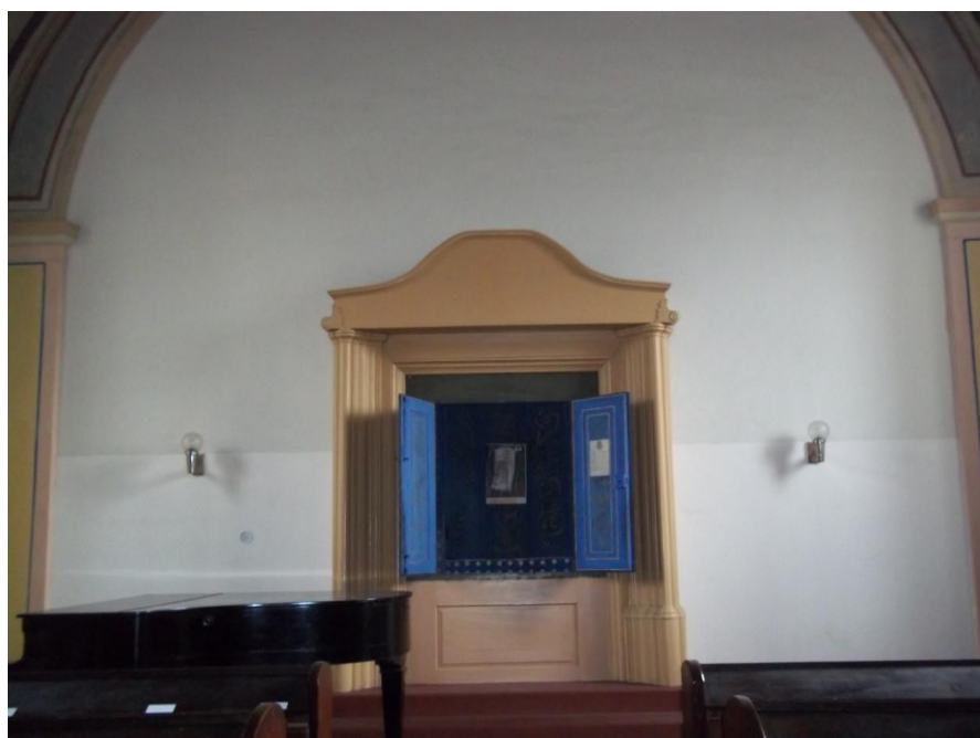
Obrázek č.5 – Expozice Synagogy ve Kdyni. Foto autorky, 2013.

Úvodní částí synagogy je předsín, tzn. spojnice mezi modlitebním sálem a rabínovým bytem, která plnila funkci shromaždiště před samotným vstupem do modlitebny. Prostor předsíně nyní slouží k expozičním účelům, nachází se zde tři informační panely a jedna vitrína. První panel předkládá návštěvníkovi poznatky o židovském osídlení v okolí Kdyně, sleduje jejich obchodní aktivity a také pozvolný