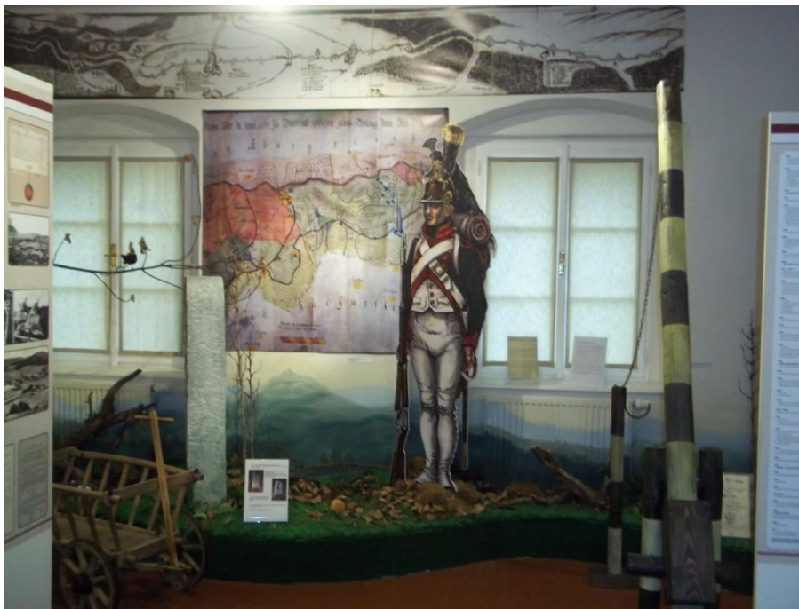
Obrázek č.3 – Expozice Muzea příhraničí ve Kdyni. Foto autorky, 2013.

Po vstupu do druhé místnosti expozice se přesuneme do středověku, s kterým se můžeme blíže seznámit pomocí replik středověké keramiky a zbraní. Atmosféru středověku umocní replika druhé hradní brány (z 2. poloviny 13. století) z hradu Rýzmbek . Další úsek je zaměřen na archeologické výzkumy a nálezy ze tří kdyňských hradů – Rýzंबरka, Nového Herštejna a Netřebu 53 .