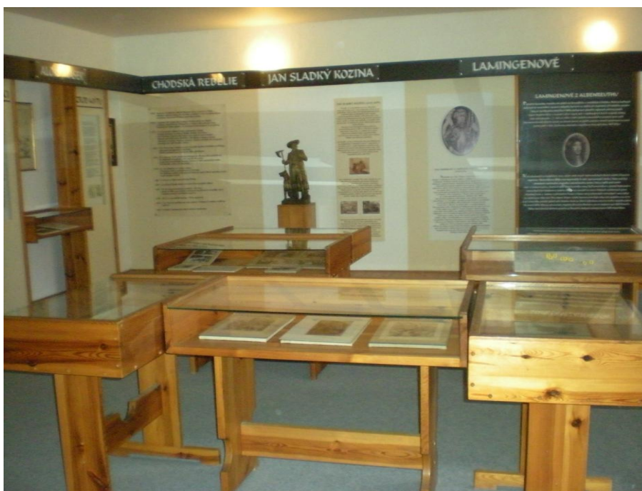
Obrázek č.10 – Expozice Pamětní síně Jana Sladkého Koziny v Újezdě.

Spektrum muzejní sbírky je vcelku široké, postrádá však užší tematické vymezení, exponáty jsou prezentovány podle nejběžnějšího způsobu muzejní instalace, tedy ve vitrínách, v muzeu nejsou uplatňovány moderní postupy v zpracování expozice. Dále nejsou k dispozici pracovní listy ani jiné obdobné programy pro základní školy. Avšak děti školního věku se také řadí mezi návštěvníky muzea, převážně se jedná o děti, které navštěvují muzeum s rodiči, organizované školní zájezdy jsou spíše výjimečnou záležitostí 84 .