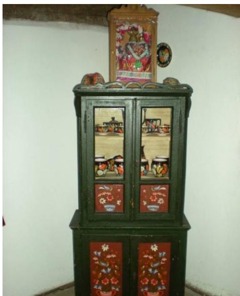
Obrázek č.8 – Expozice Dražnovského špýcharu. Foto autorky, 2013.

Přesto se domnívám, že muzeum lze doporučit k navštívení, snad díky jeho přínosu v oblasti mapování místní historie, nebo vzhledem k architektonické podobě objektu samotného. Míněna je tím zdařilá rekonstrukce špýcharu a celého areálu historického rychtářství .