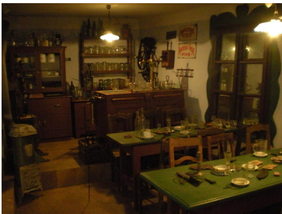
Obrázek č.15 – Expozice Muzea techniky a řemesel v Kolovči. Foto autorky, 2013.

Při samotném vstupu do vůbec největší expoziční plochy se návštěvník seznámí se šperkařským náčiním, hřebenařstvím 107 . Další kroky zavedou návštěvníka k zedníkům, kominíkům, kamnářům, řezbářům, slaměnkářům, košíkářům, dřevorubcům, krajkářkám, kloboučníkům, kožešníkům a soustružníkům. Z dané tematiky řemesel se vymyká část věnovaná školní třídě, v tomto případě se jedná o podobu školní třídy v roce 1929. Samozřejmě v ní nechybí základní vybavení žáků a rovněž hudební nástroje,