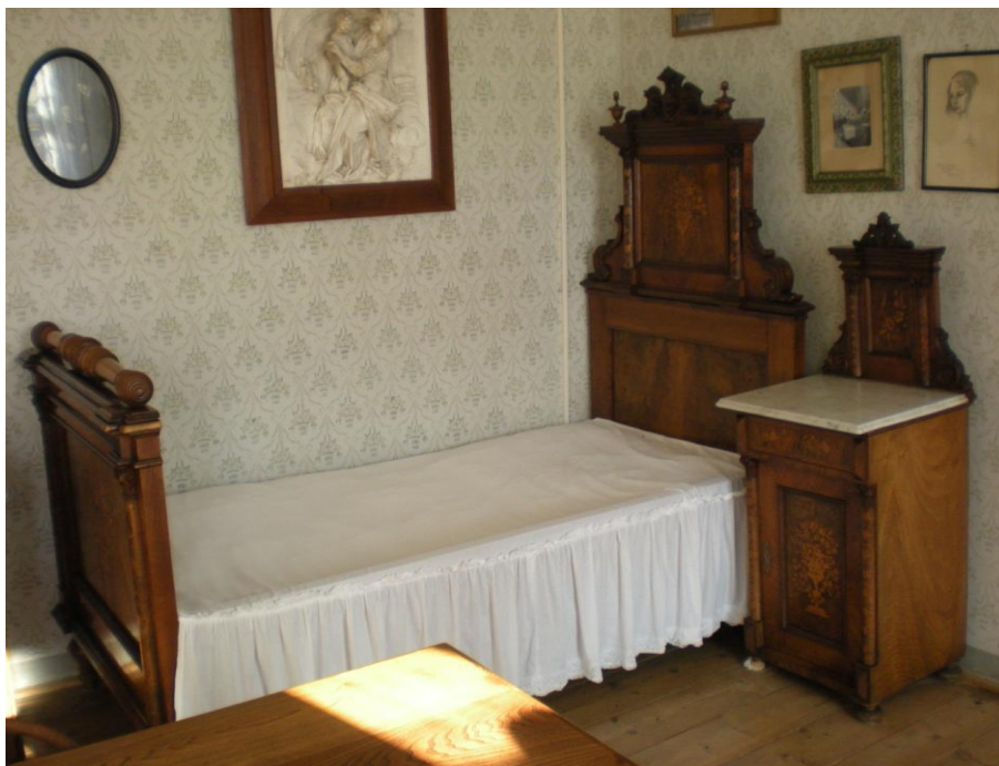
Obrázek č.13 – Expozice Baarova muzea v Klenčí pod Čerchovem.

Prostory sloužící k účelům expozice jsou situovány v přízemí a prvním patře Baarova domu, přičemž exponáty jsou vystaveny v celkem sedmi místnostech, dále v knihovně, předsíni a na schodišti vedoucím do prvního patra.