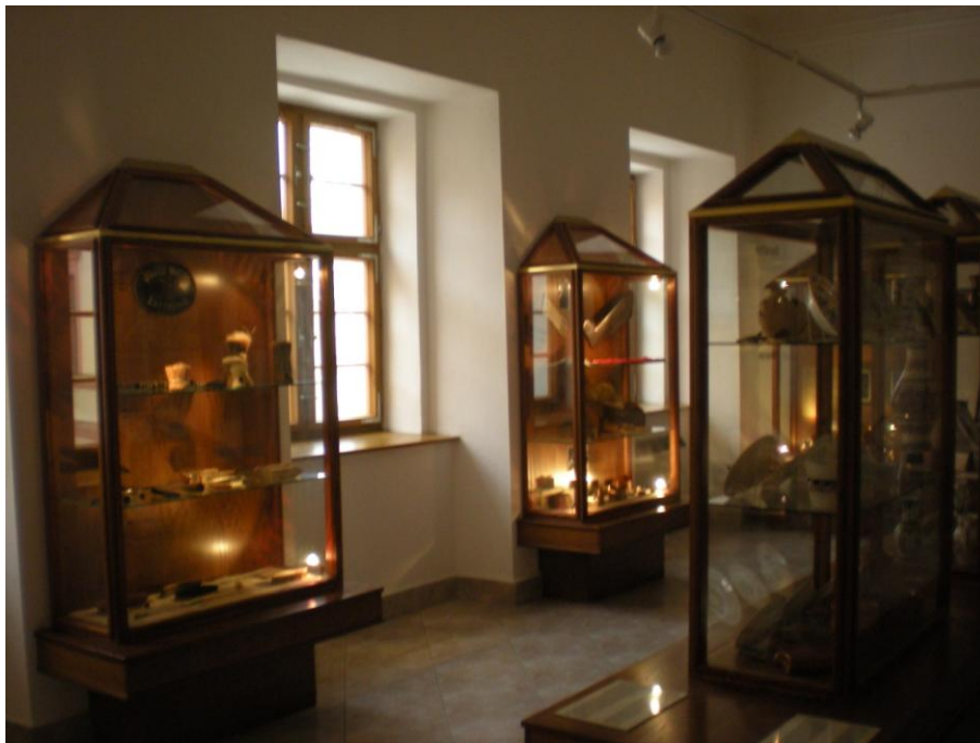
Obrázek č.2 – Expozice Muzea Chodska. Foto autorky, 2013.

Další síň „ Historie (17. – 19. století) “ je naplněna ukázkami nábytku, mezi nimi renesanční polychromovanou skříní, barokním sekretářem a prádelníkem, aj. Nechybí ani dřevěné olejem malované ostrostřelecké terče z 19. století a další předměty běžné potřeby.