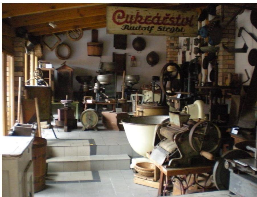
Obrázek č.16 – Expozice Muzea techniky a řemesel v Kolovči. Foto autorky, 2013.

Z výše uvedených informací lze vyvodit myšlenku, že by se správní orgán chodu muzea v Kolovči mohl víc věnovat současným přístupům k režii muzejnictví, což by potenciálně mohlo vést k zvýšení návštěvnosti školními skupinami. Právě tady příslušníci mladé generace mají možnost seznámit se s širokou škálou řemesel, která jsou nyní opomíjena, a některá z nich dokonce zapomenuta.