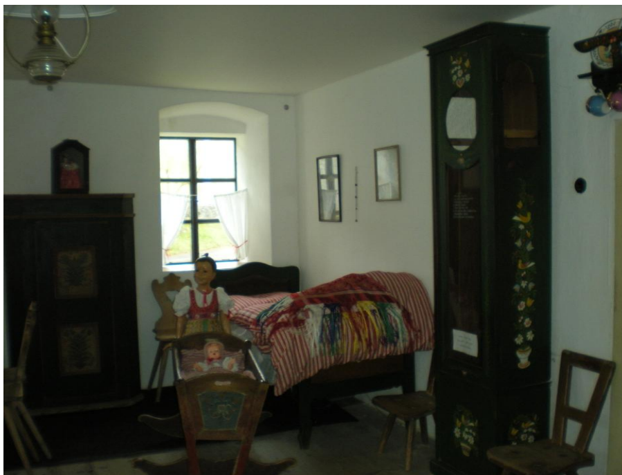
Obrázek č.9 – Expozice Pamětní síně Jana Sladkého Koziny v Újezdě. Foto autorky, 2013.

Chodská rebelie konce 17. století žije v povědomí obyvatel nejen chodských oblastí až do dnešních dnů, proto je v muzeu vcelku podrobně zmapována, k dokreslení představy rozsahu povstání slouží mapka s vyznačenými místy dějišť rebelií.