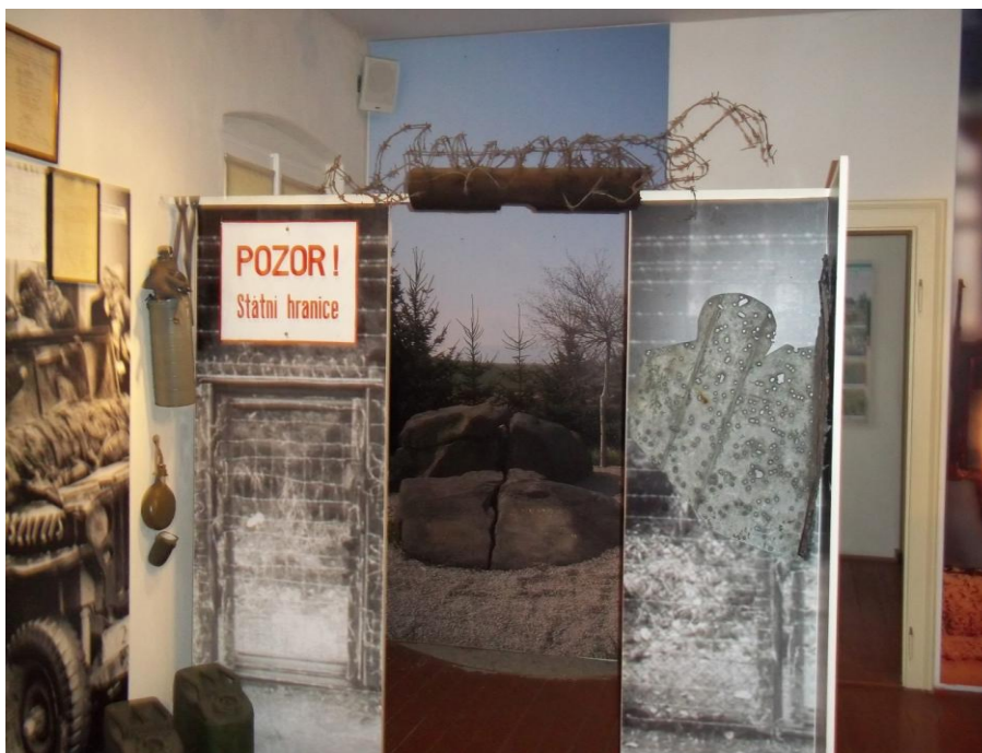
Obrázek č.4 – Expozice Muzea příhraničí ve Kdyni. Foto autorky, 2013.

Čtvrtá, pátá a šestá místnost jsou veskrze zaměřeny na stejné téma, a to textilní výrobu, která je s Kdyní velice úzce spjata, mimo jiné jsou představeny tradiční technologie zpracování lnu na výrobu plátna.