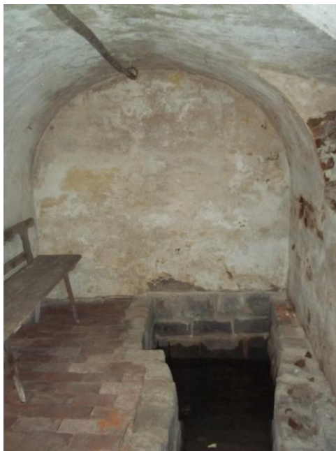
Obrázek č.6 – Expozice Synagogy ve Kdyni.