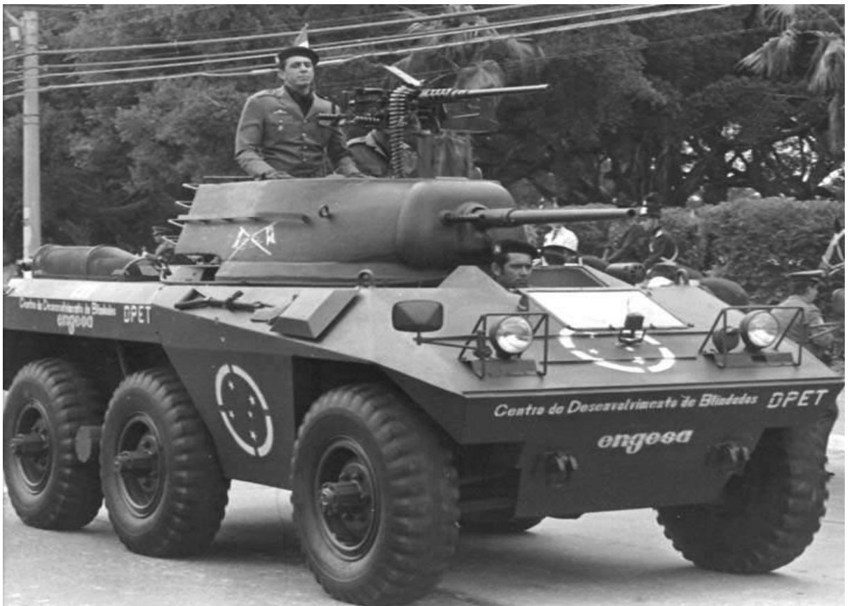
Příloha č. 16: Obrněný vůz M8 Greyhound.