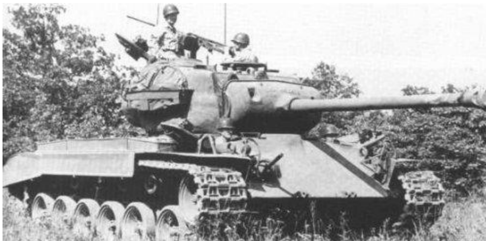
Příloha č. 20: Těžký tank M26 Pershing.