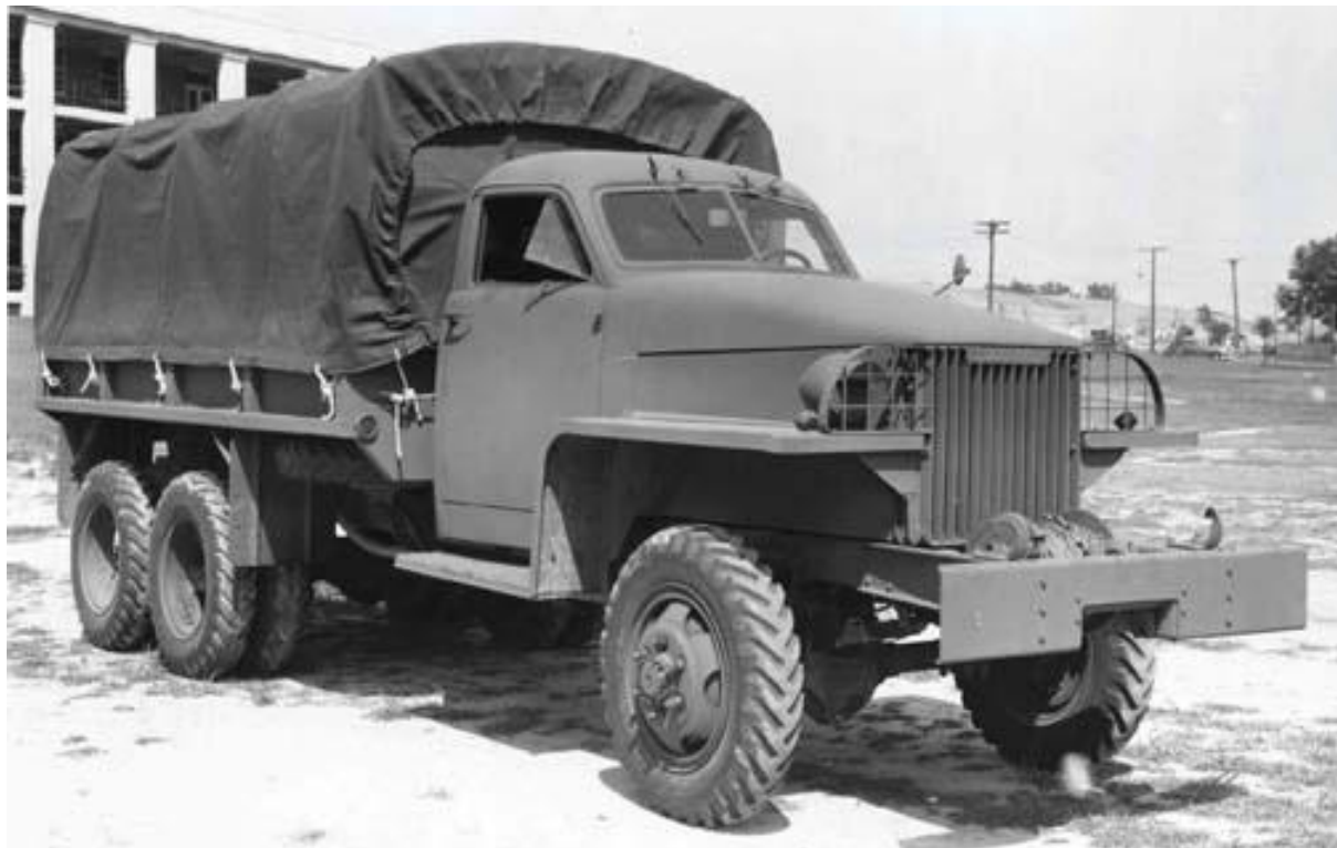
Příloha: č. 14: Nákladní vůz značky Studebaker.