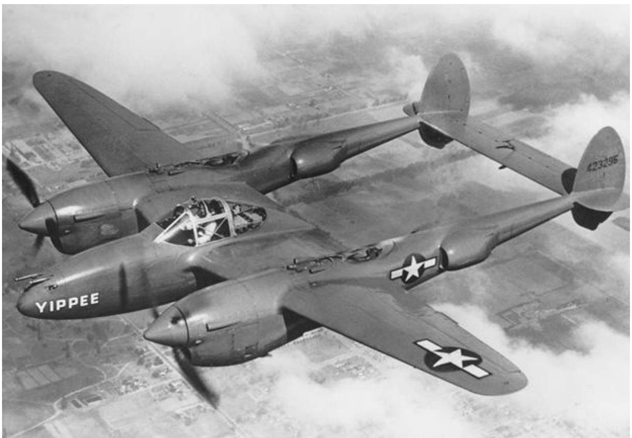
Příloha č. 12: Letoun P-38 Lightning.