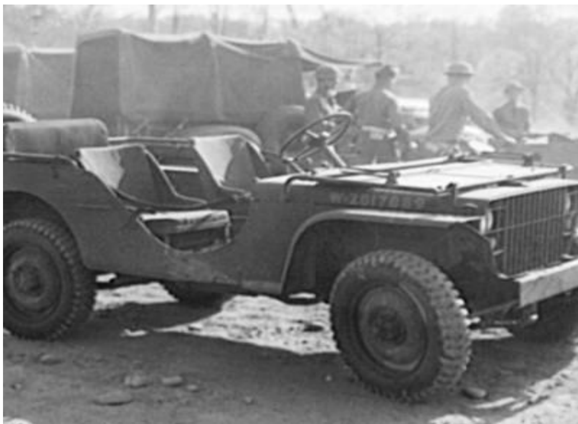
Příloha č. 13: Americký jeep Willys.