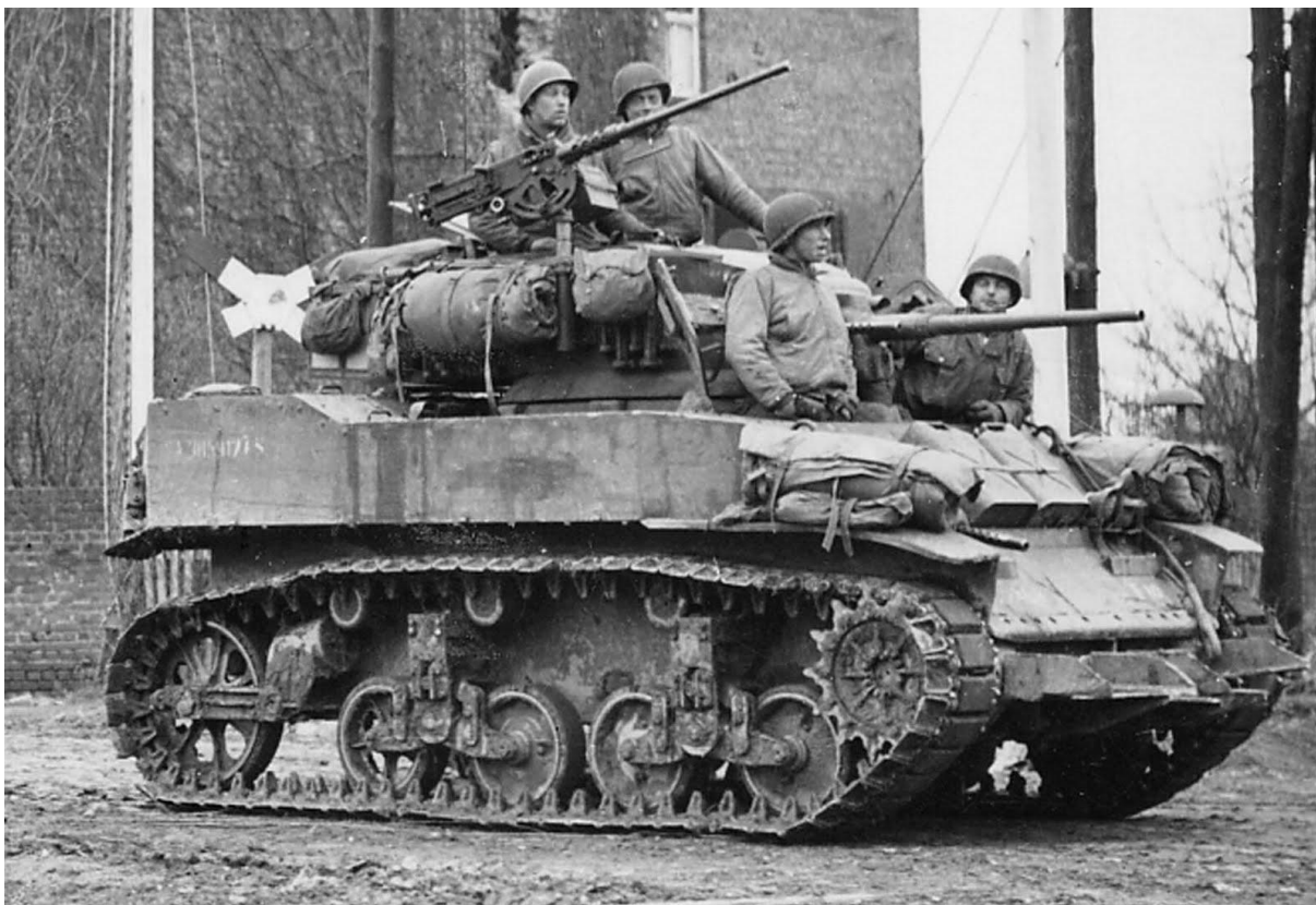
Příloha č. 17: Lehký tank M5A1 Stuart.