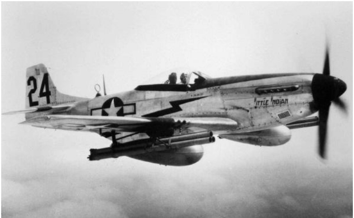
Příloha č. 11: Letoun P-51 Mustang.