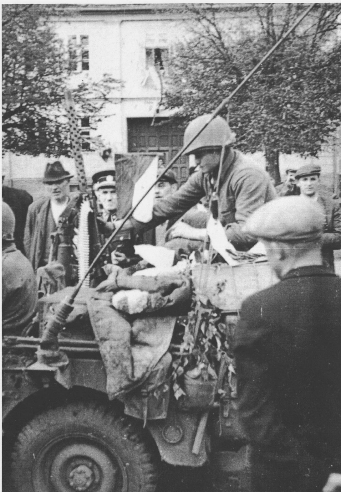
Příloha č. 5: Americký jeep obklopen obyvateli Spáleného Poříčí