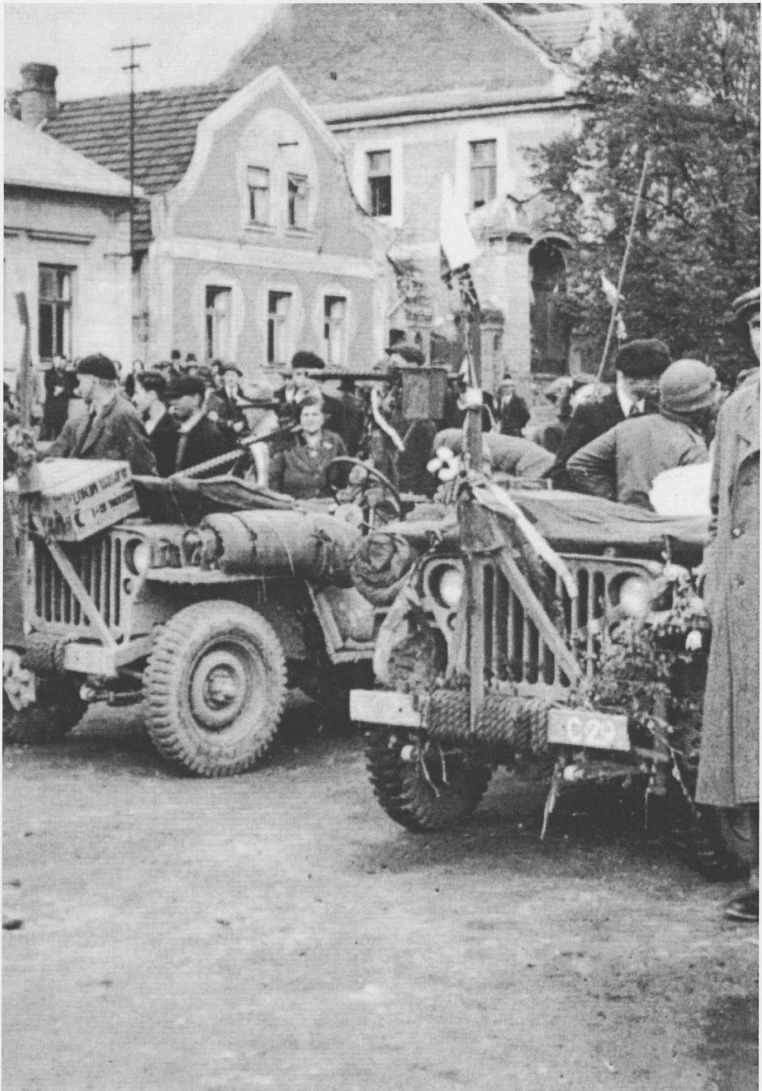
Příloha č. 4: Americké jeepy na náměstí ve Spáleném Poříčí.