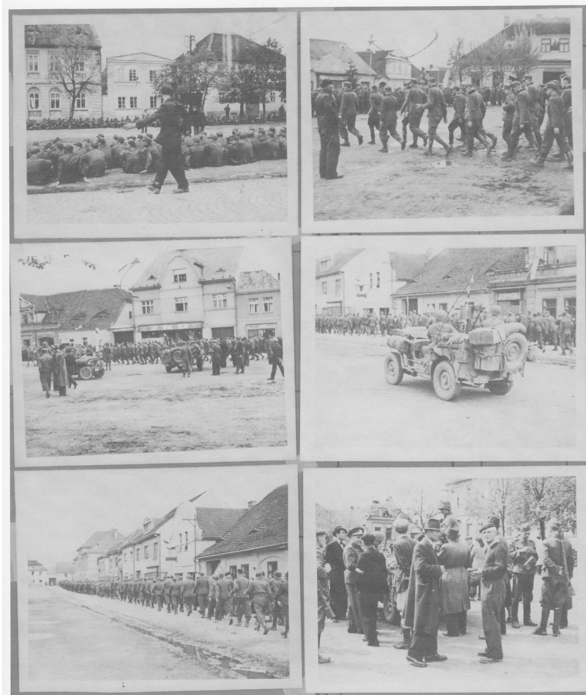
Příloha č.3: Zajatí němečtí vojáci na náměstí Spáleného Poříčí.