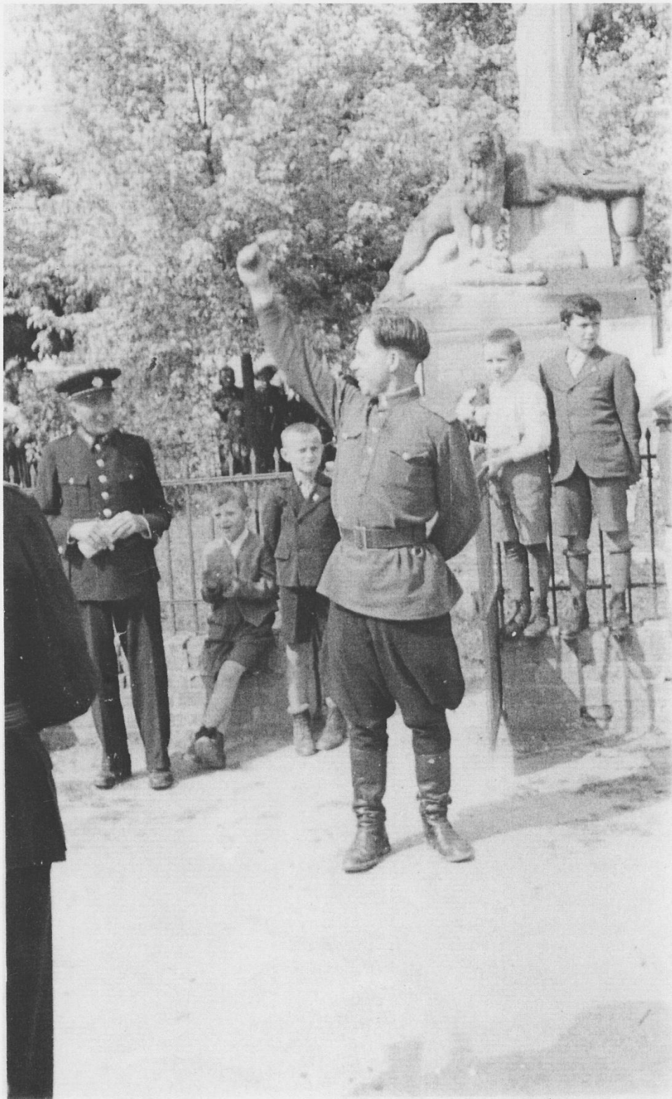
Příloha č. 7: Sovětský důstojník před pomníkem obětem 1. světové války ve Spáleném Poříčí.