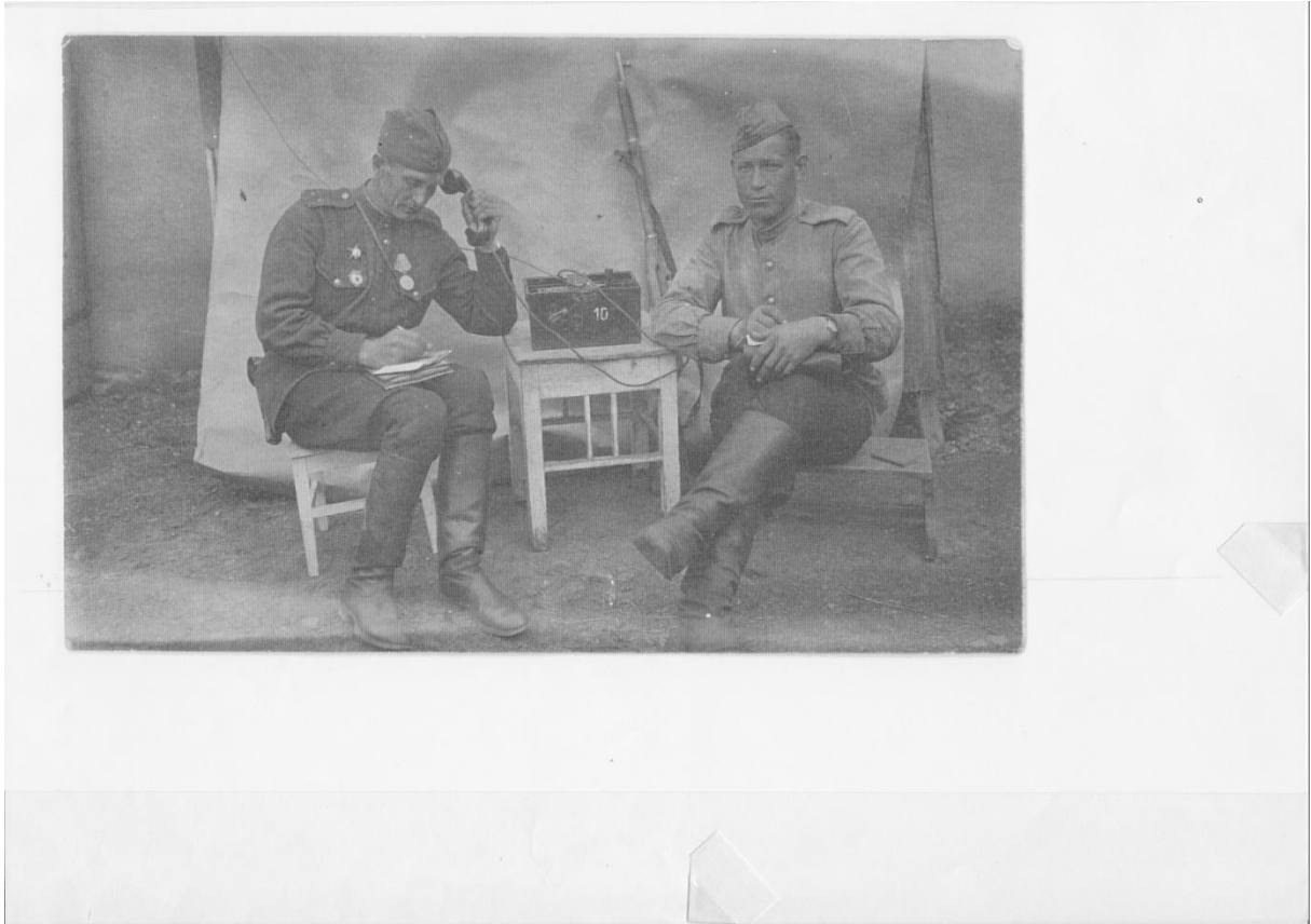
Příloha č. 9: Sovětská radiostanice ve Spáleném Poříčí.