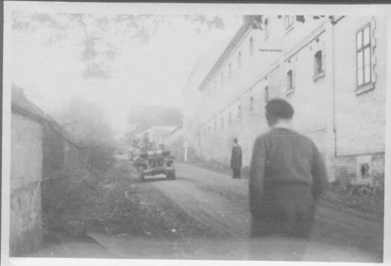
Příloha č. 2: Příjezd prvních amerických vojáků od Lipnice.