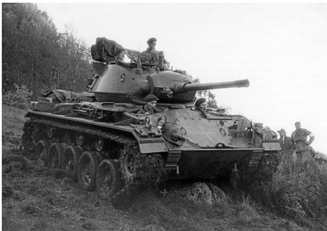
Příloha č. 18: Lehký tank M24 Chaffee.