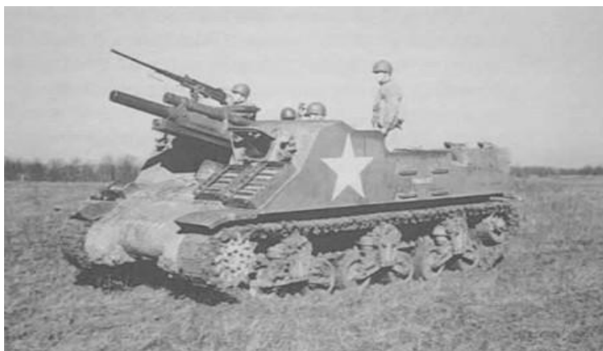
Příloha č. 21: Samohybná houfnice M7 Priest.