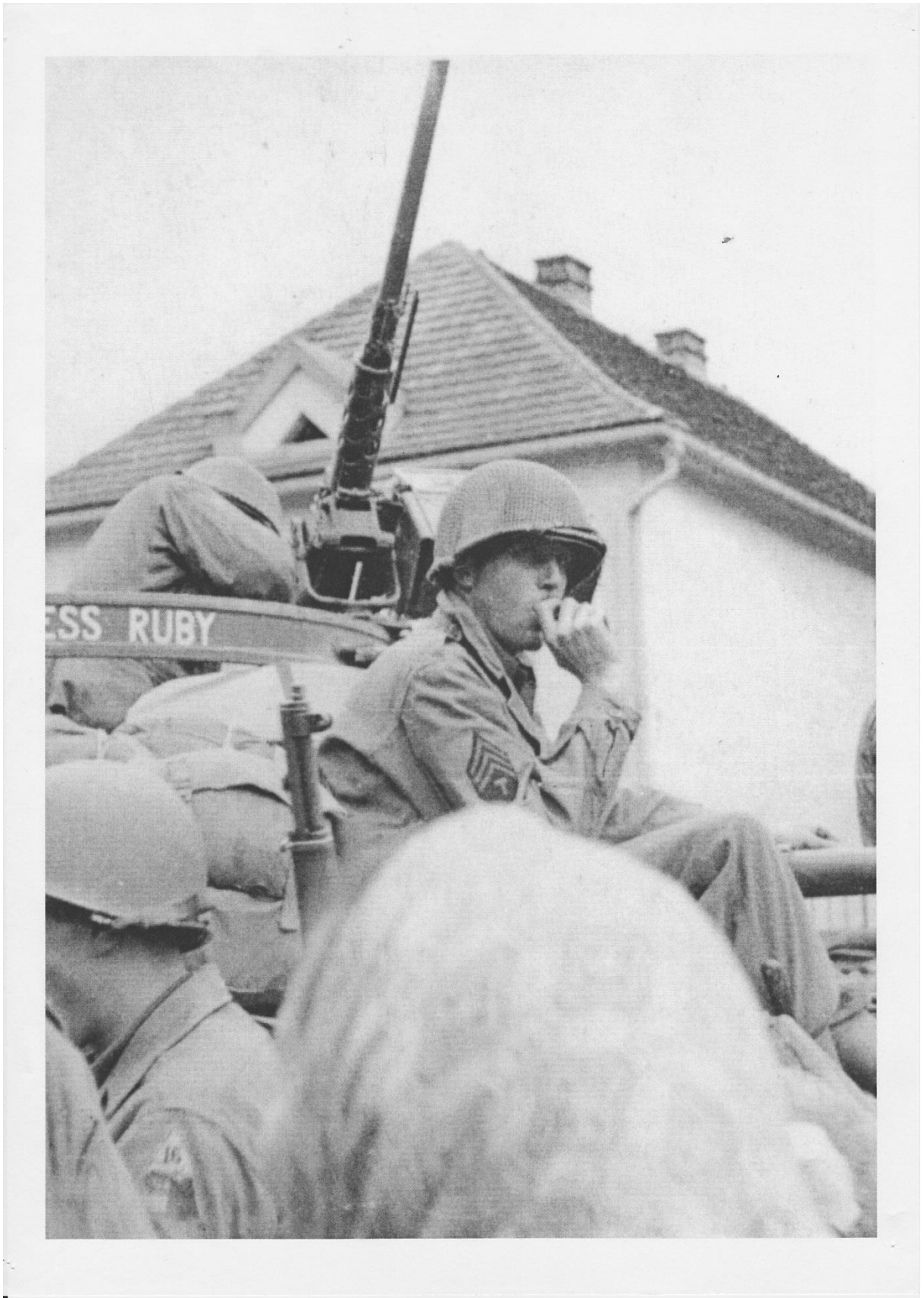
Příloha č. 6: Americký voják na vozidle M8 Greyhound.