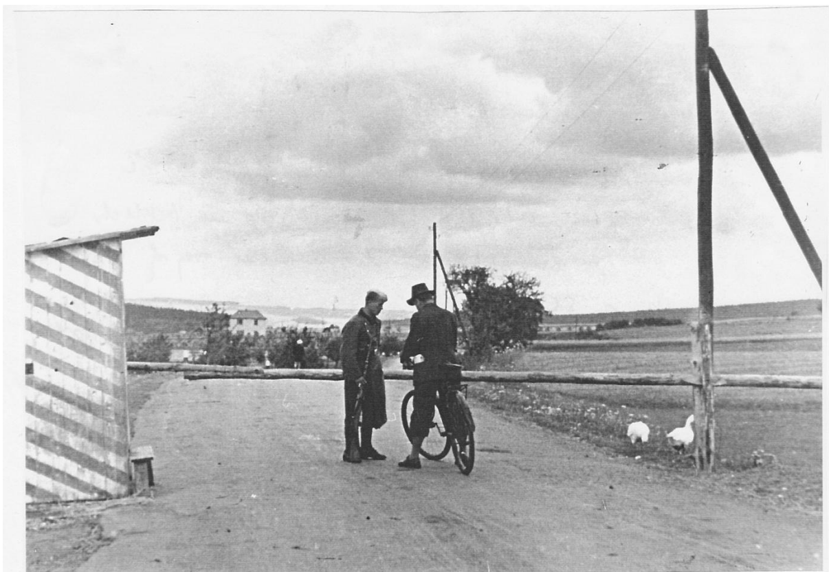
Příloha č. 8: Závora a sovětská strážní budka na konci Spáleného Poříčí směrem na Nezvěstice.