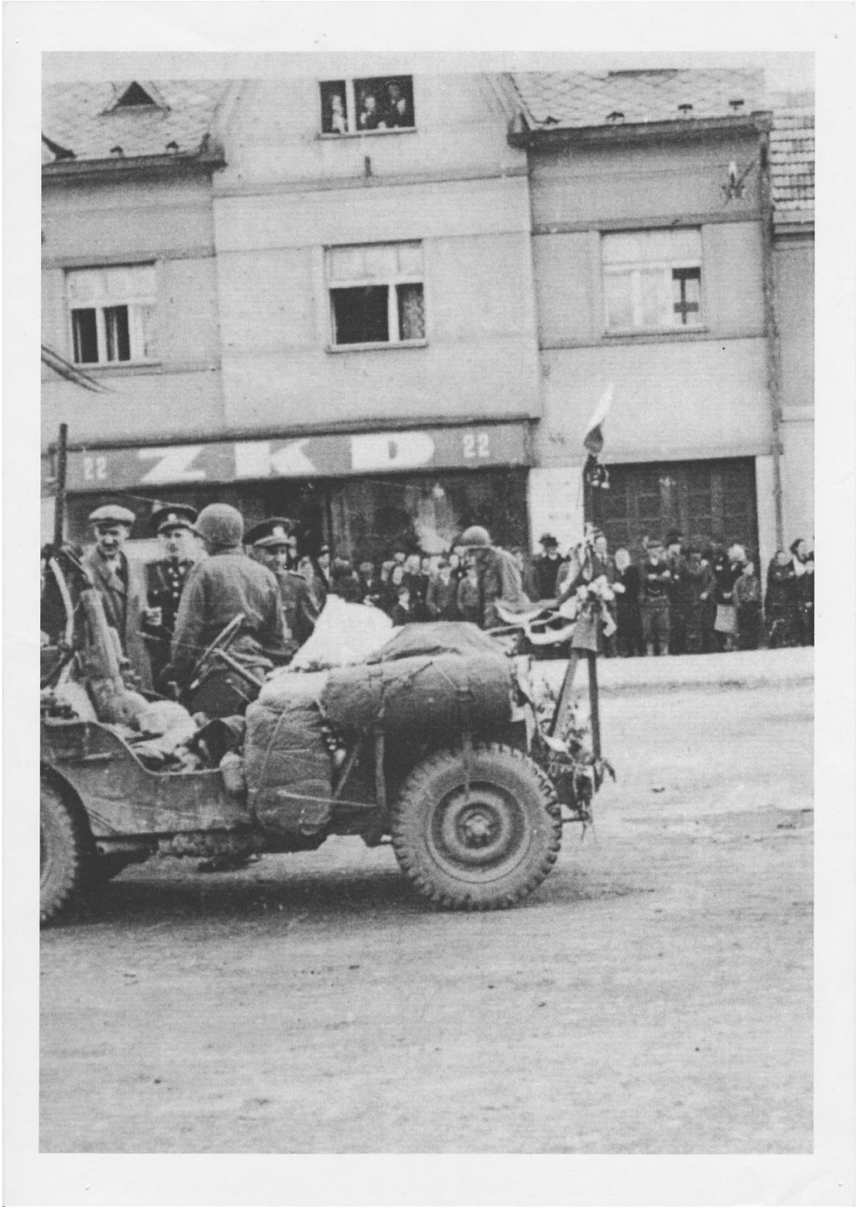
Příloha č. 1: Americký jeep před tehdeším konzumním družstvem.