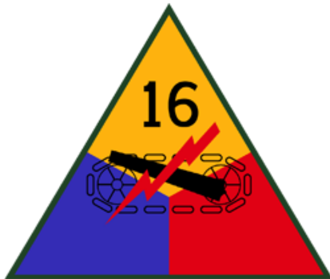
Příloha č. 23: Znak 16. Obrněné divize.