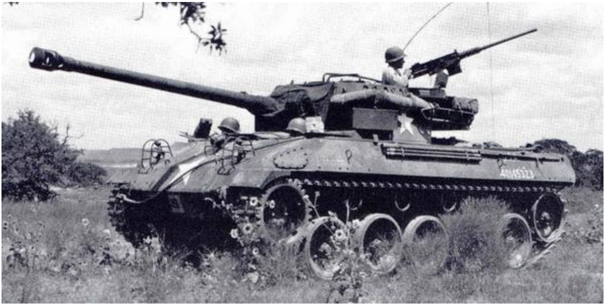
Příloha č. 22: Samohybné dělo M18 Hellcat.