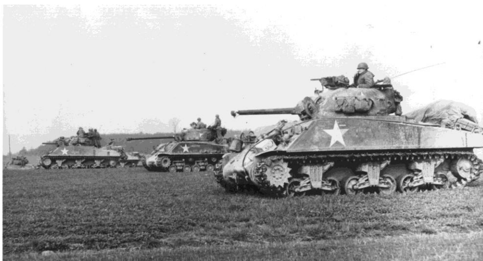
Příloha č. 19: Střední tank M4 Sherman.