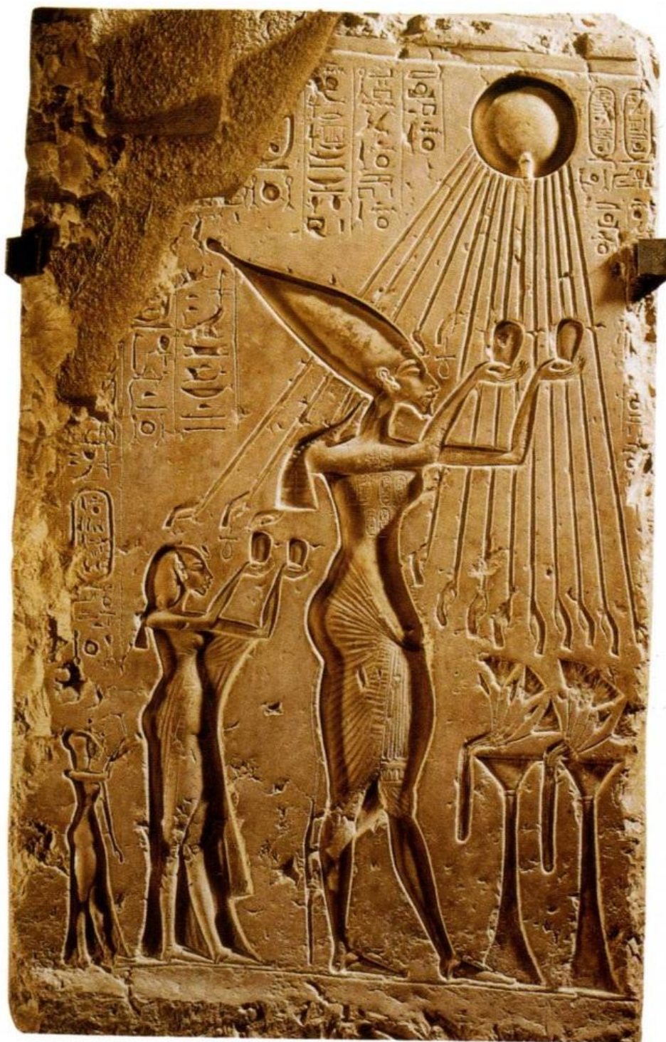
JOHNSON, P. Civilizace starého Egypta , s. 62.