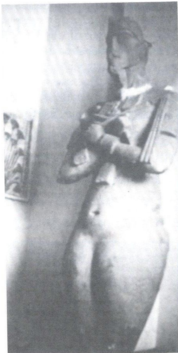
JACQ, Ch. Nefertiti a Achnaton , s. 112-113. [fotografie umístěna na neočíslované příloze mezi těmito stranami]