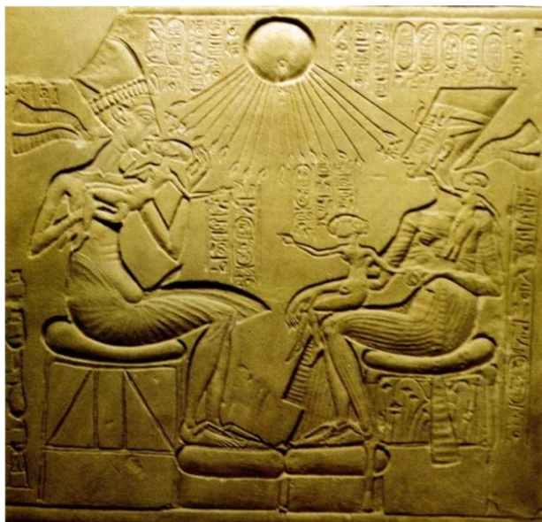
JOHNSON, P. Civilizace starého Egypta , s. 88.