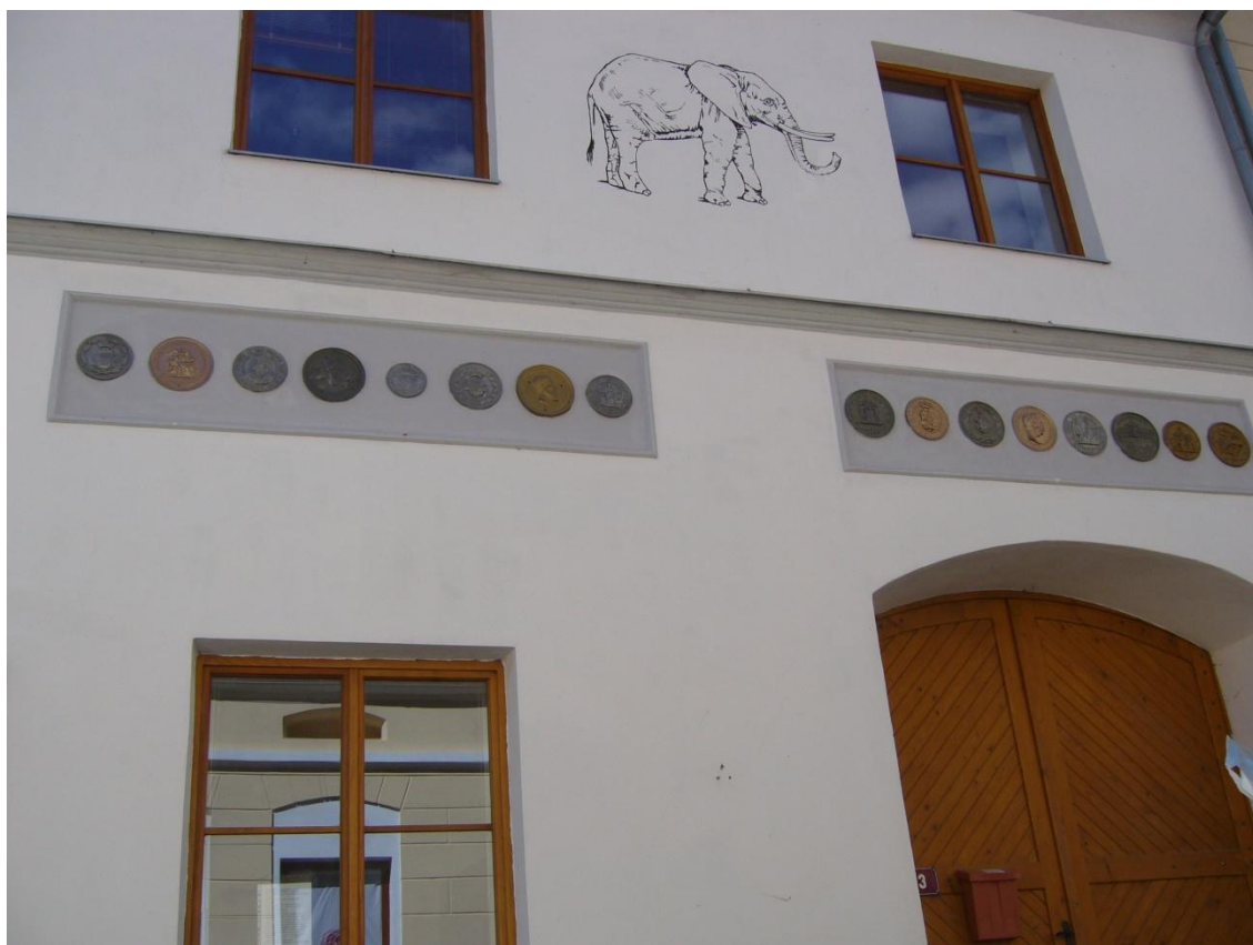
Obrázek č. 1