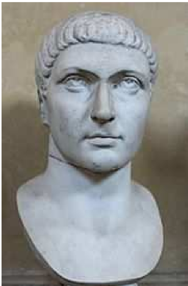
Obr. 2 – Mramorová socha císaře Konstantina I. umístěná ve Vatikánském muzeu Chiaramonti.