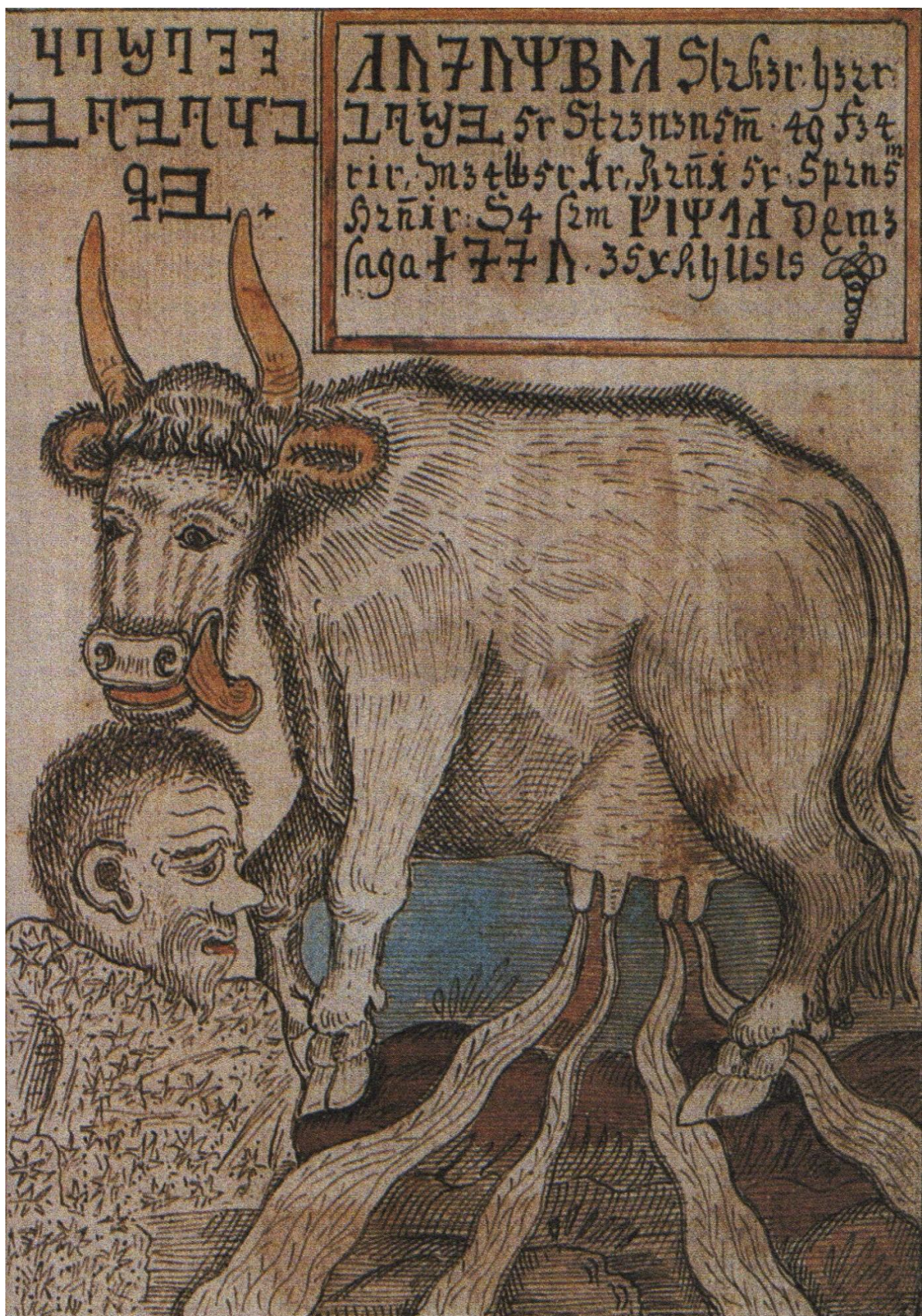
Obrázek 6 - Kráva Adhumla olizuje slané kameny, z nichž povstává obr Búri.

Zdroj: Sturluson, S. Edda a Sága o Ynglinzích, s. 47.