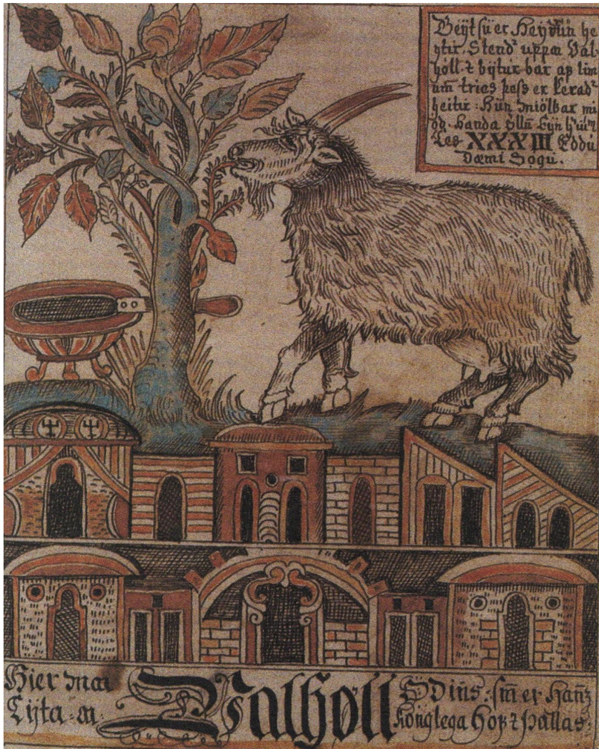
Obrázek 5 - Koza Heidrún na střeše Vallhaly okusuje strom a dojí medovinu pro bojovníky.