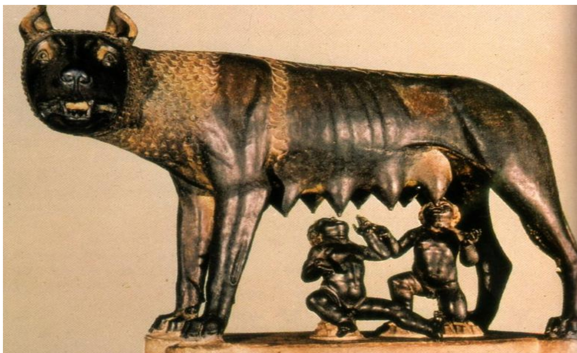
Obrázek 4 - Vlčice kojící dvojčata Romula a Rema.