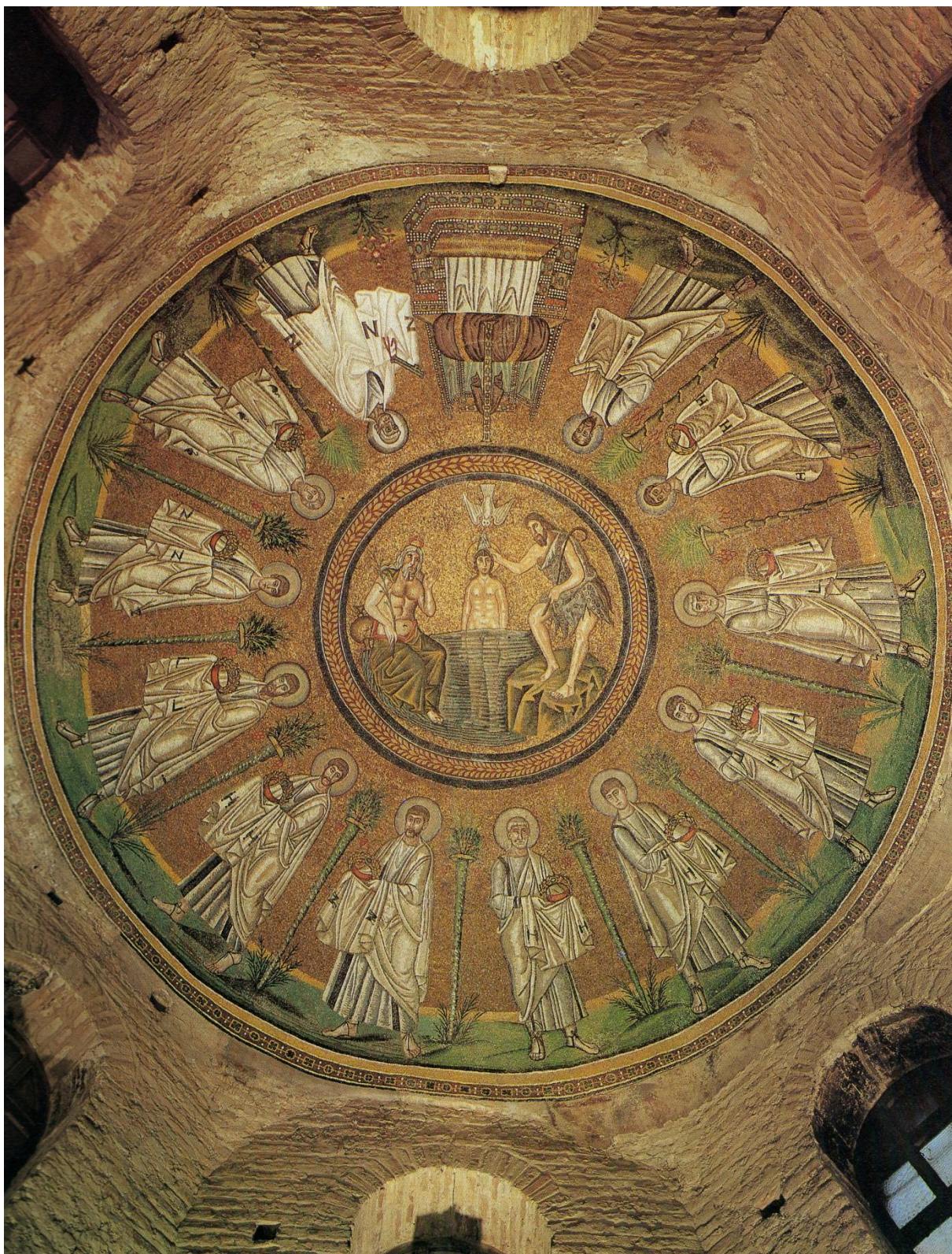
Obrázek 11 - Mozaika kupole ariánského baptisteria v Raveně. Vznik za vlády Theodericha I.