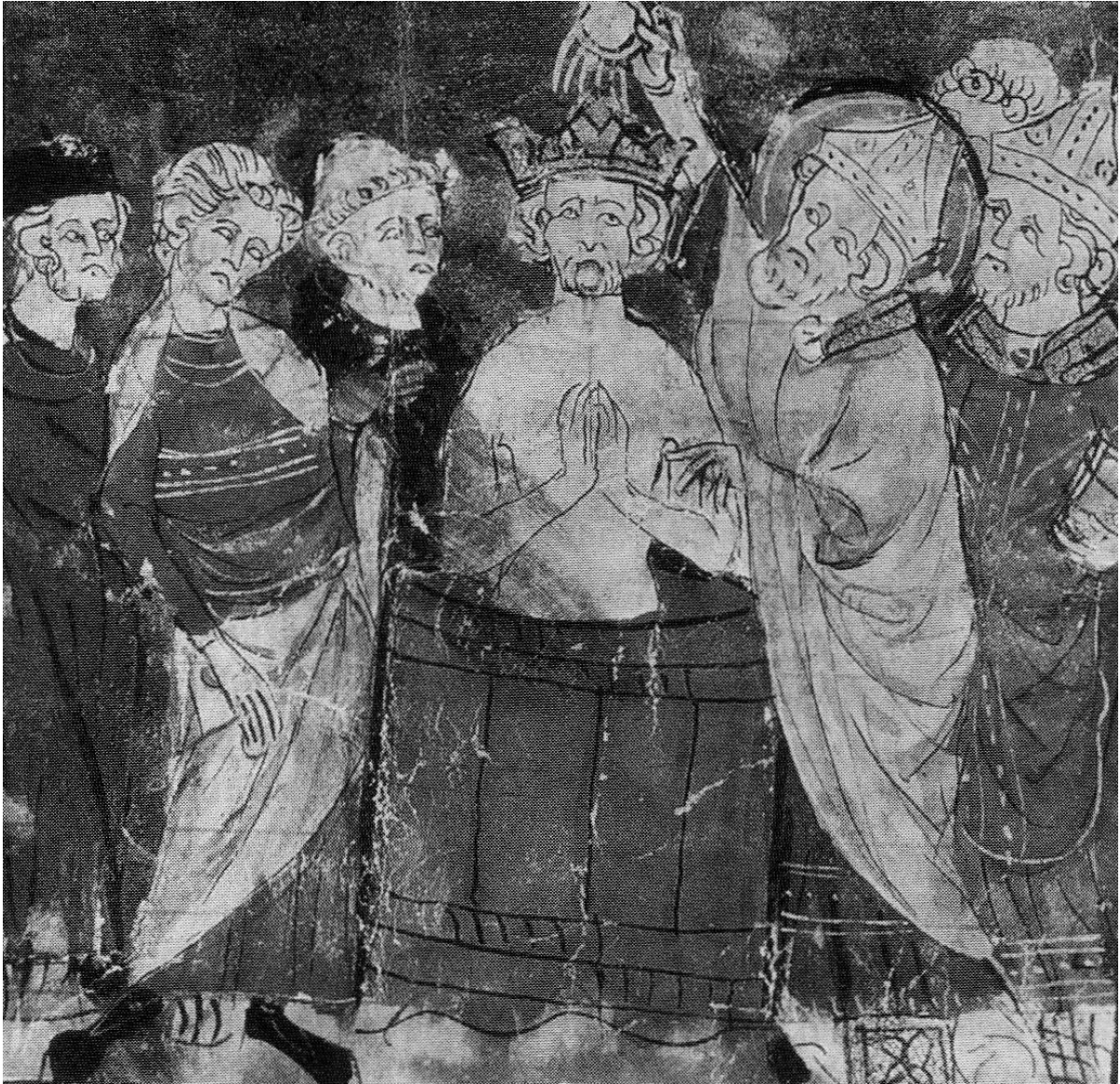
Obrázek 10 - Chlodvíkův křest

Zdroj: Bednaříková, J. Frankové a Evropa, s. 154.