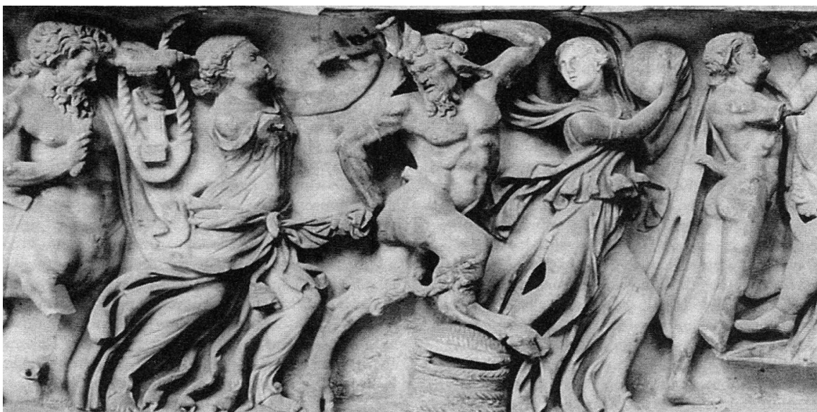
Obrázek 3 - Výjev z bakchanálií zobrazený na rakvi. Tento rituál představoval vítězství nespoutané přírody nad pořádkem nastoleným lidmi.

Zdroj: Adkins, L. Adkins, R. A. Antický Řím, s. 320.