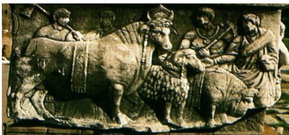
Obrázek 2 - Monument vzniklý ve 4. Století za vlády císaře Diokleciána. Obětování vola, ovce a prasete.

Zdroj: Cornell T. Matthews, J. Svět starého Říma, s. 95