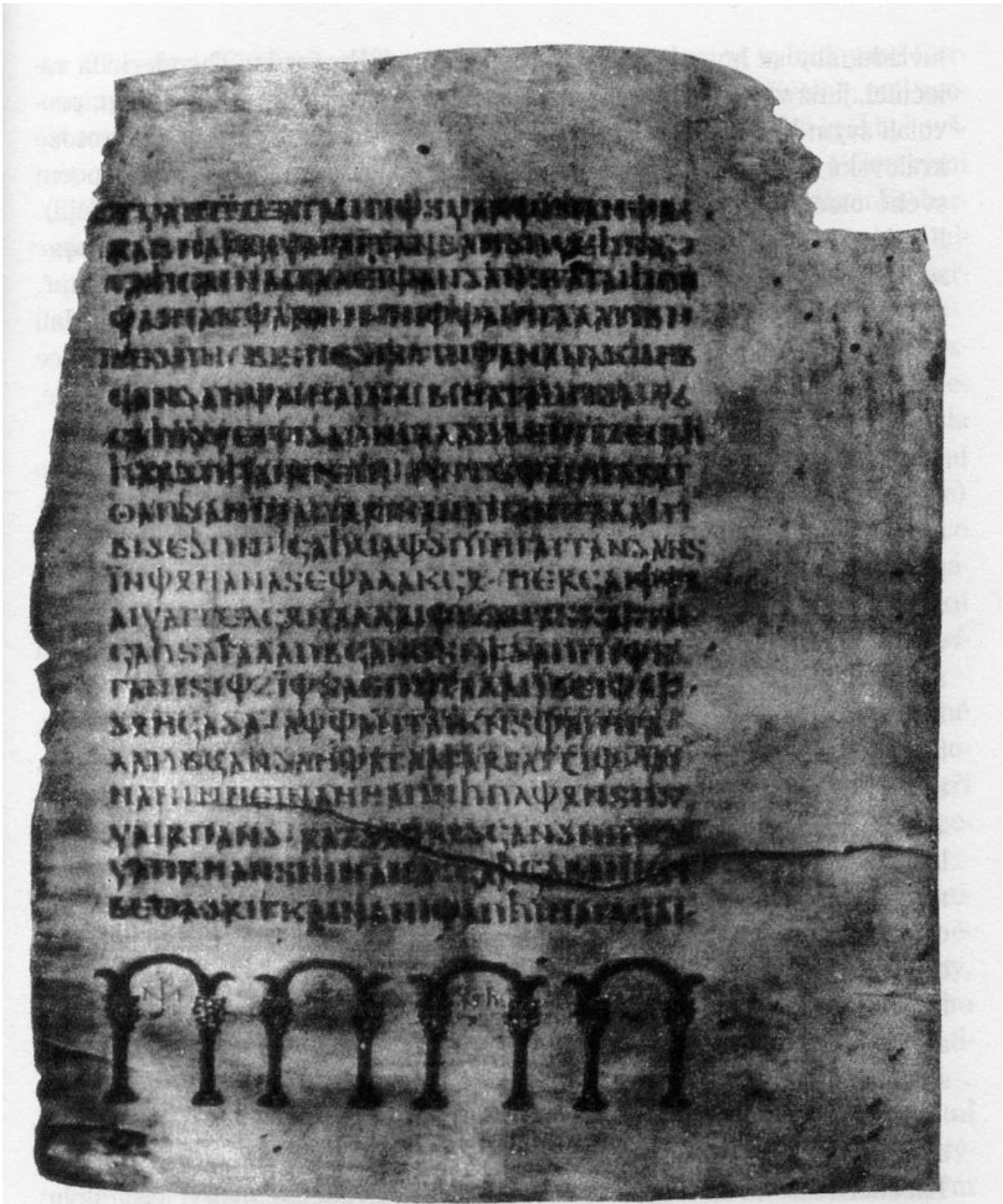
Obrázek 9 - Wulfiliv Codex Argenteus – Otčenáš v gótsčině.