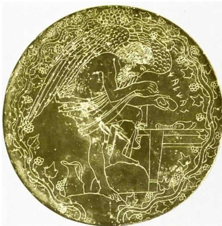
Obrázek 1 - Etruské zrcadlo zobrazující věšce – haruspika, který provádí věštba z vnitřností zvířat.