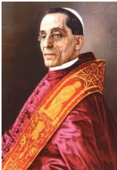
Papež Benedikt XV.