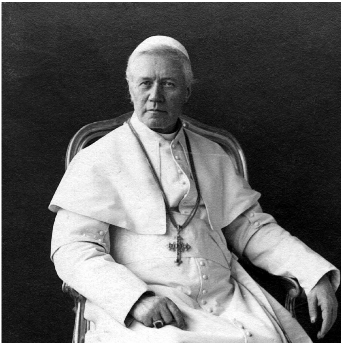
Papež Pius X.