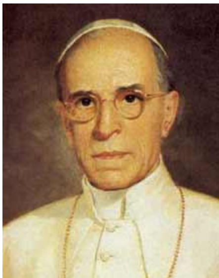
Papež Pius XII.