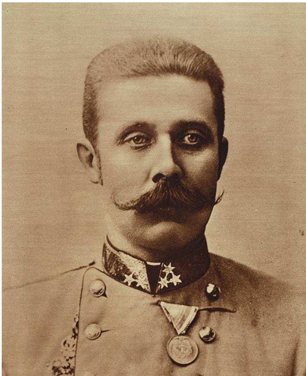
Arcivévoda František Ferdinand d'Este

Zdroj : http://cs.wikipedia.org/wiki/Soubor:Franz_ferdinand.jpg .