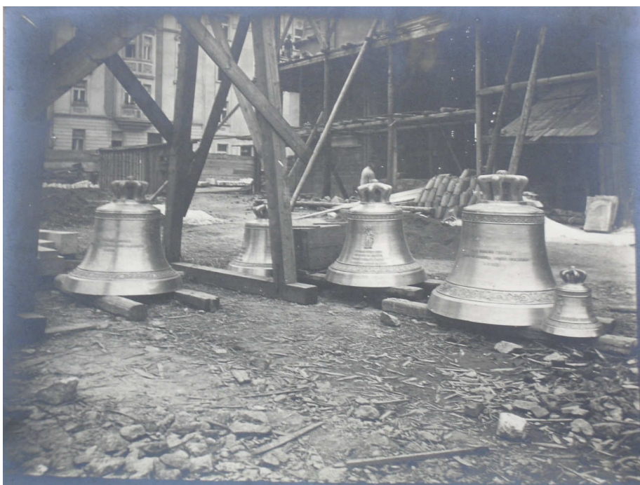
Obr. č. 4: Zvony pro dominikánský kostel v roce 1913. 134