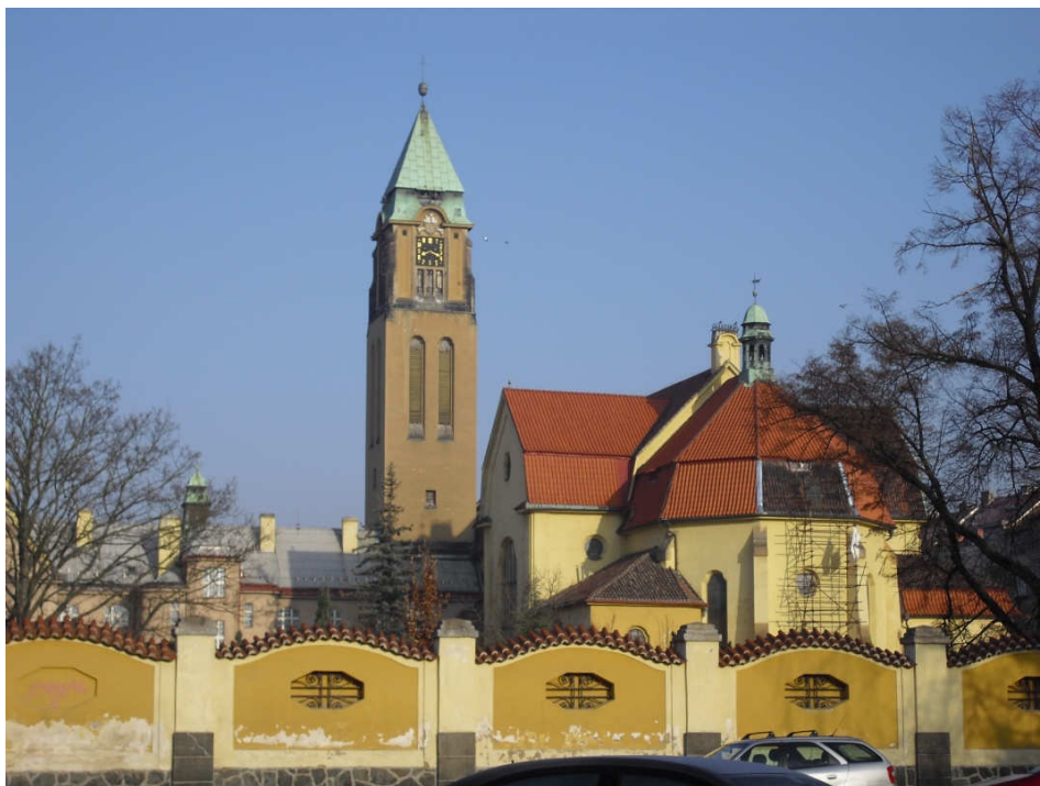
Obr. č. 5: Dominikánský klášter v roce 2013. 135