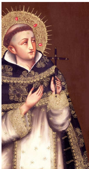
Obr. č. 2: Portrét sv. Dominika. 132