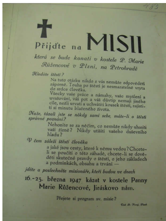
Obr. č. 7: Pozvánka na lidové misie z roku 1947. 137