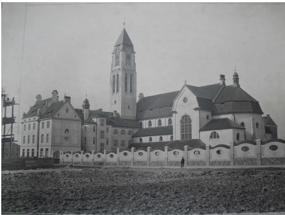
Obr. č. 3: Farní kostel Panny Marie Růžencové s dominikánským klášterem na Pražském předměstí v roce 1925. 133