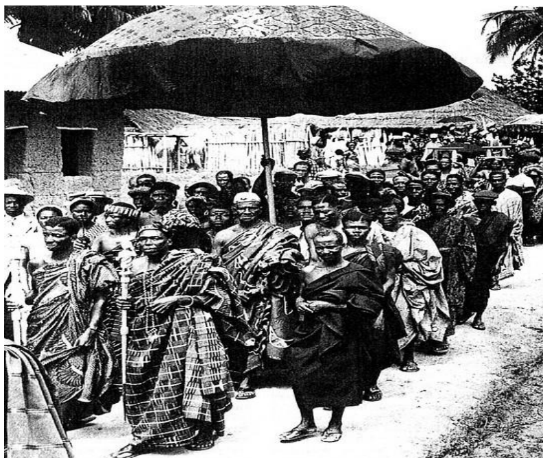
Obr. č. 3. Náčelníci Ghany 1954