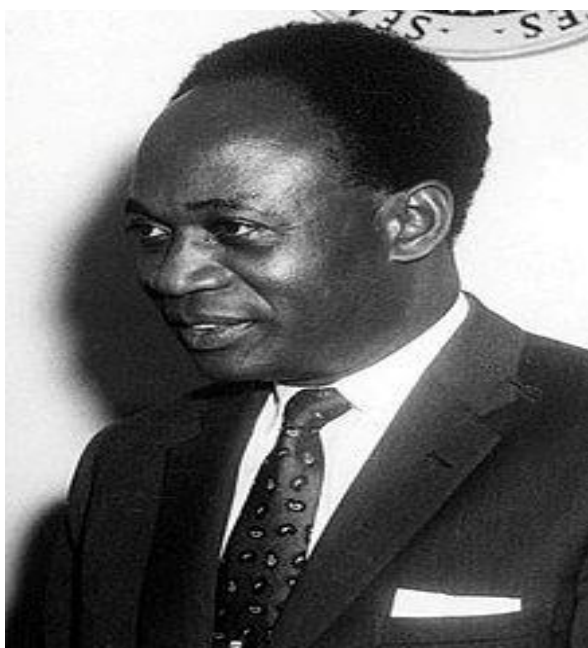
Obr. č. 2. Kwame Nkrumah