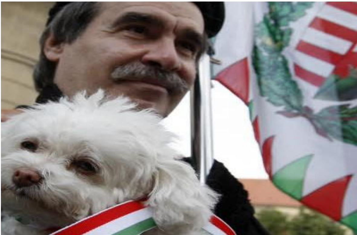
Ein Unterstützer der ungarischen Neonazipartei Jobbik.

Mutige Menschen, die vor zwanzig Jahren mit ihrer Zivilcourage Mitteleuropas Sowjet-Diktaturen ein Ende bereitet haben, sind heute zutiefst verzagt. Gerade wer in Ungarn den Umbau des Zwangsstaates in eine demokratische Gesellschaft mit angetrieben hat, fürchtet sich aus gutem Grund.