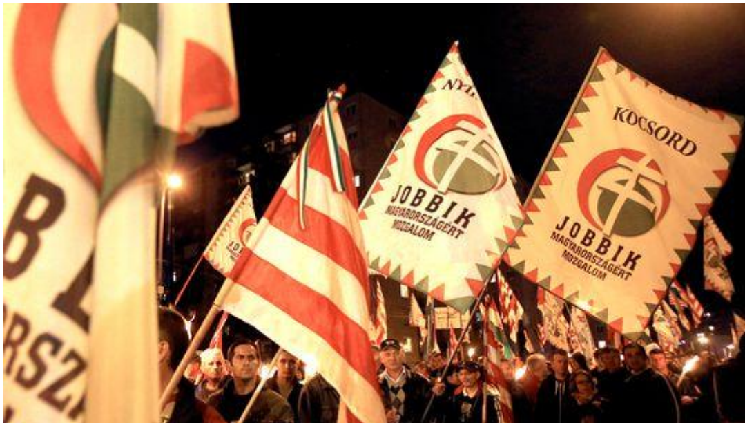
Anhänger der Jobbik-Partei demonstrieren in Miskolc

Mehr als 1.000 Rechtsextremisten haben am Mittwochabend in der ostungarischen Stadt Miskolc gegen die Roma-Bevölkerung protestiert. Aufgerufen zu der Kundgebung in der Plattenbau-Siedlung Avas hatte die rechtsradikale Parlamentspartei Jobbik (Die Besseren). Unter den Teilnehmern waren auch uniformierte Mitglieder der verbotenen, paramilitärischen Ungarischen Garde . Der Jobbik-Vorsitzende Gabor Vona sagte in seiner Ansprache unter Anspielung auf die allgemein