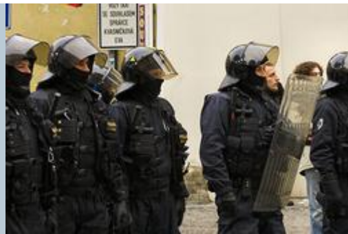
Tschechische Polizisten: Zigeunergewalt außer Kontrolle

PRAG. Nach mehreren Übergriffen von Zigeunern auf Einheimische in Nordböhmen hat die tschechische Regierung die Bildung einer Polizei-Spezialeinheit angekündigt, um weitere Gewalt zu verhindern. Der parteilose Innenminister Jan Kubice sagte, die Lage in der Region sei völlig außer Kontrolle, berichtet die Nachrichtenagentur AFP . Der neuen Sondereinheit sollen 200 Beamte angehören.