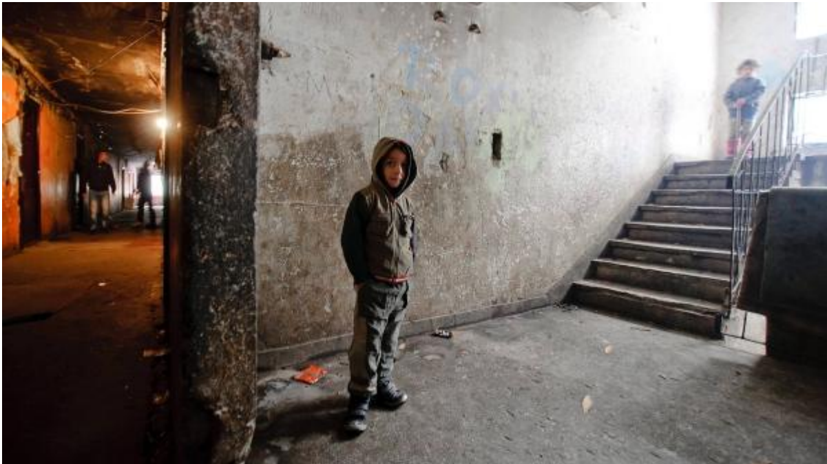
Kinder in einem Slum im Nordwesten Rumäniens

Die osteuropäischen Roma sind in Nordwesteuropa angekommen - erst physisch und nun auch in den Debatten über Armutseinwanderung und überlastete Städte. Dass jetzt zur besten Sendezeit über das Phänomen diskutiert wird, ist eigentlich eine gute Nachricht, denn bis vor kurzem interessierte sich kaum jemand dafür. Einige Medienberichte über die Roma erinnern allerdings an den Kabarettisten Gerhard Polt, der in seinem Text „Alles über den Russen“ einen aus dem Osten heimgekehrten bayerischen Touristen über die russische Seele sinnieren lässt.