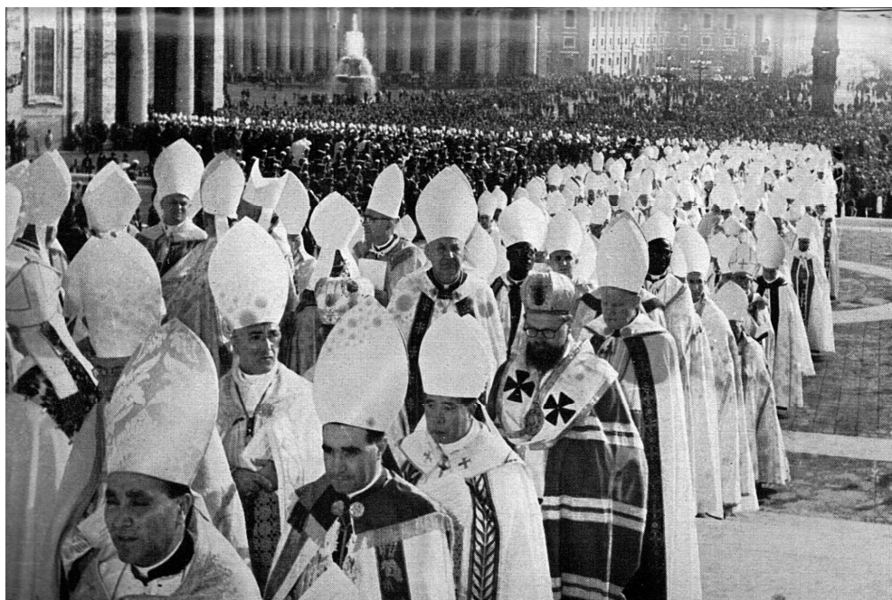
Slavnostní průvod biskupů do baziliky sv. Petra při zahájení koncilu